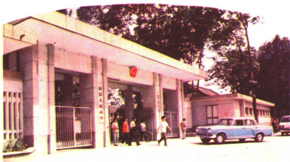
彭县人民政府及其驻地