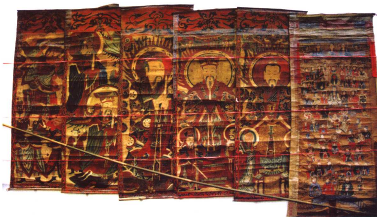
湖南江永瑶族师公神祇画像