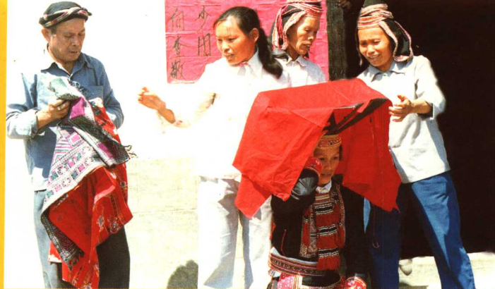
广西荔浦盘瑶出嫁