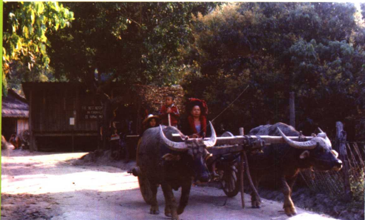
泰国清莱府瑶族的牛车