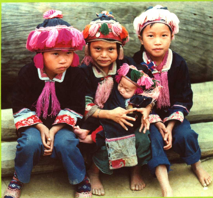
广西百色蓝靛瑶小孩