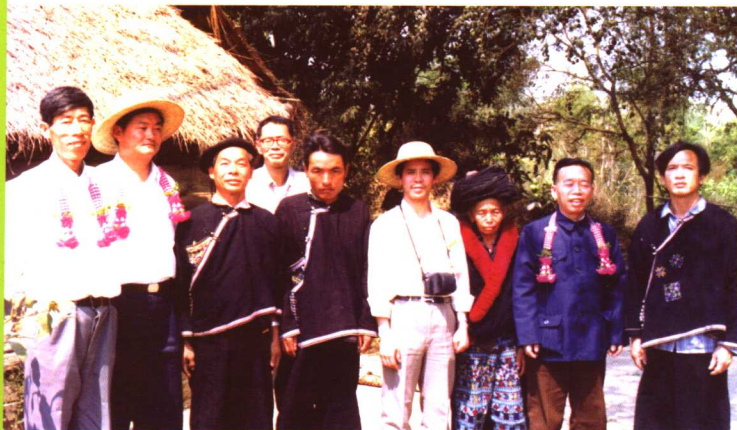
本文作者在泰国与泰国瑶族合影