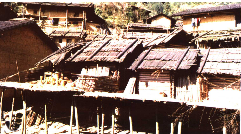
广西金秀山子瑶民居