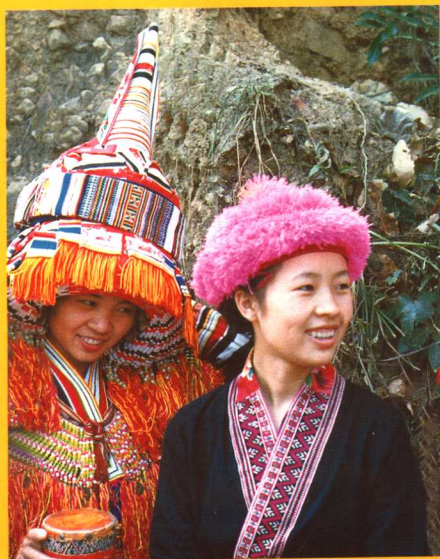
广西贺州市盘瑶未嫁女