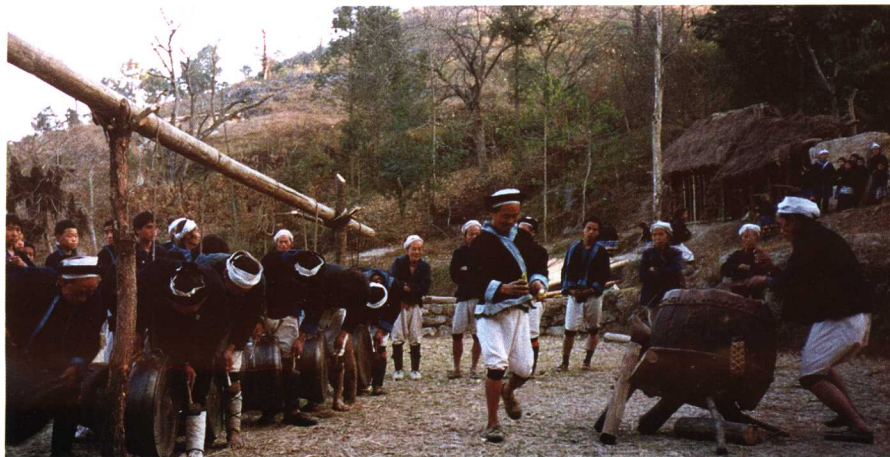
广西南丹白裤瑶打铜鼓