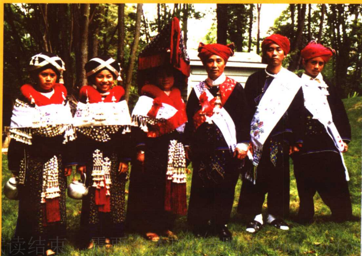
美国华盛顿州西雅图瑶族服饰