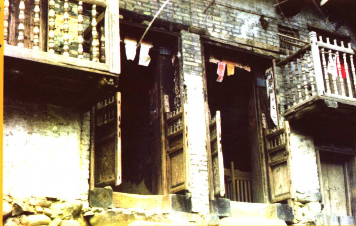
广西金秀茶山瑶干栏