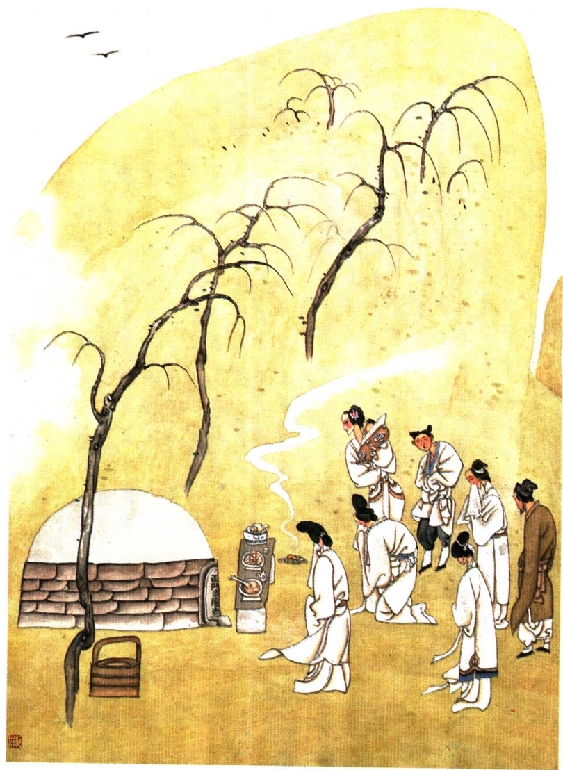
清明节寡妇上新坟