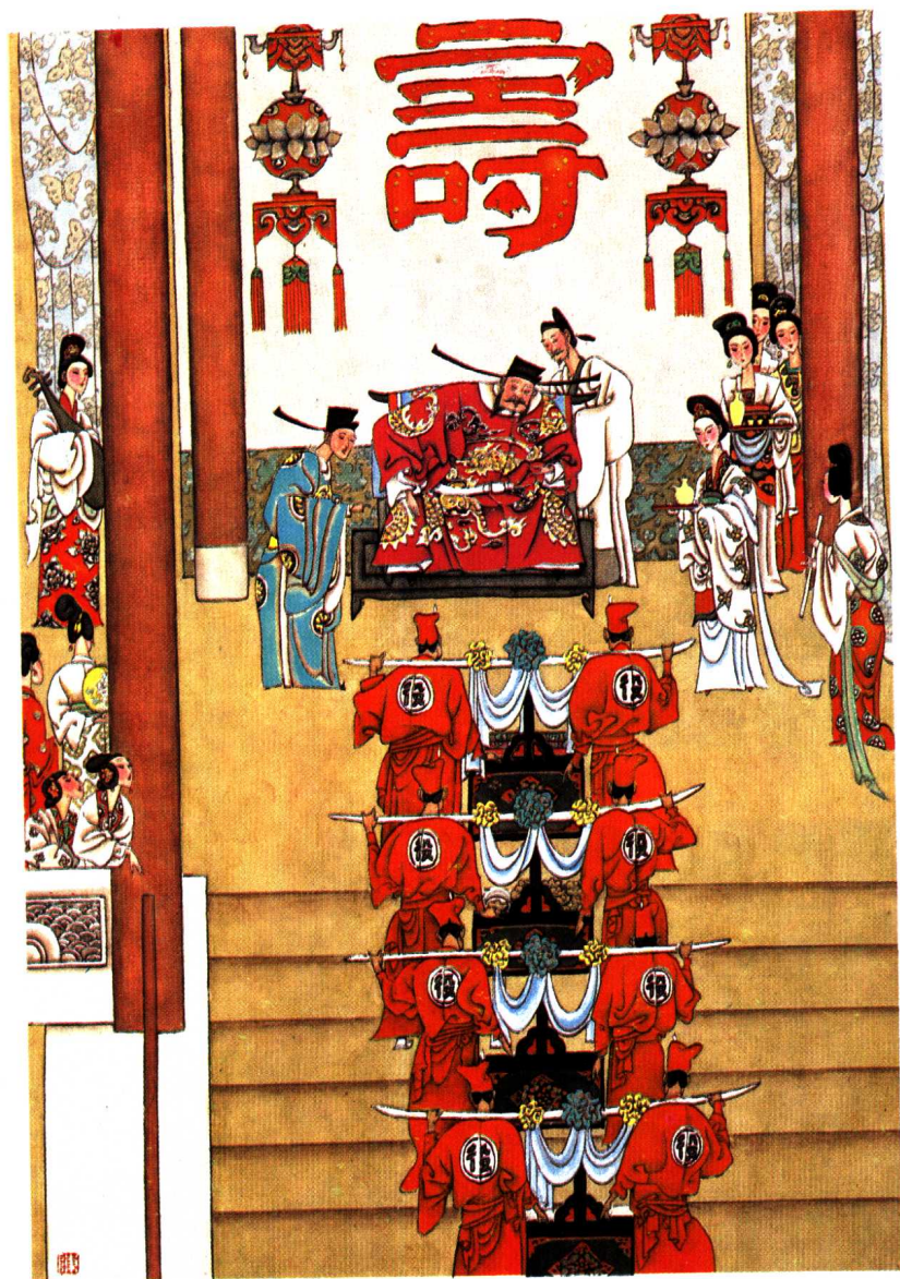
西门庆两番庆寿诞