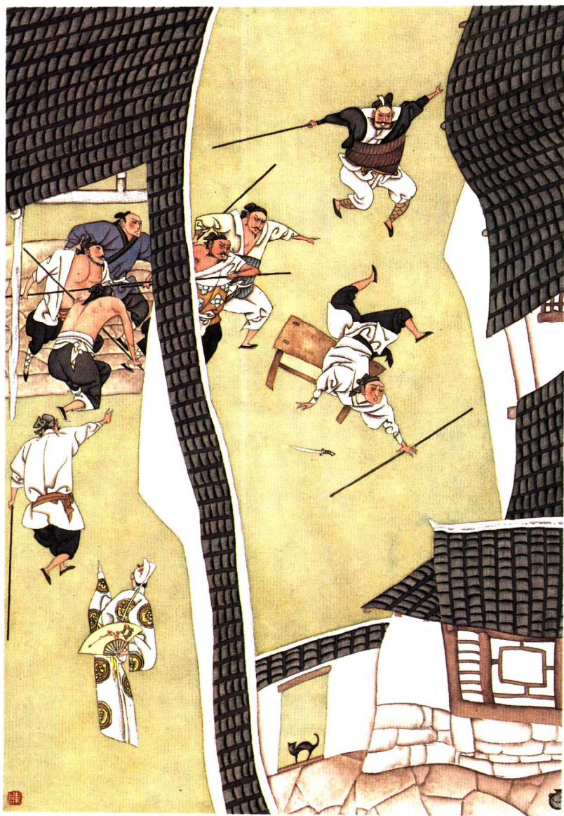
西门庆暗算来旺儿