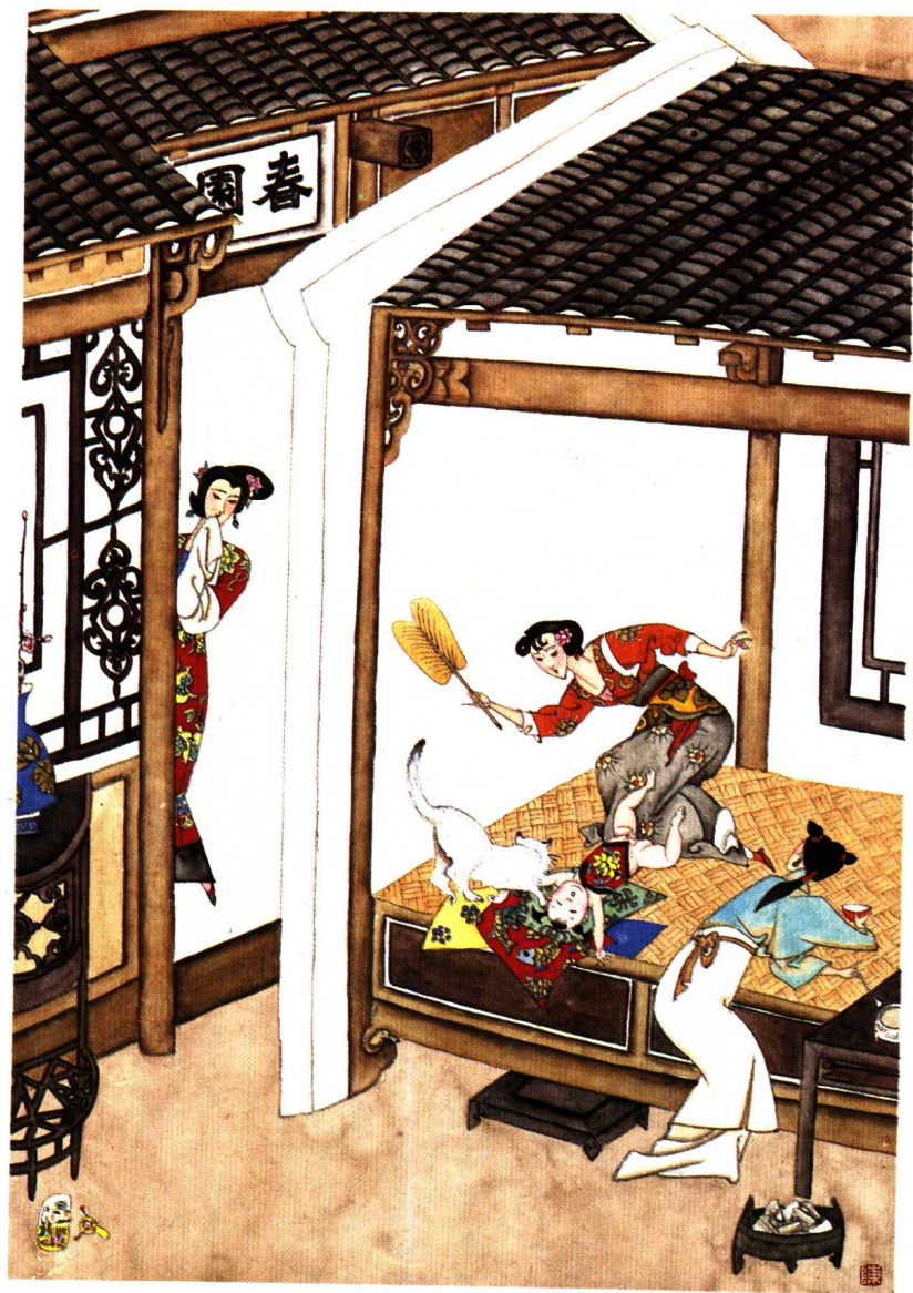
李瓶儿睹物哭官哥