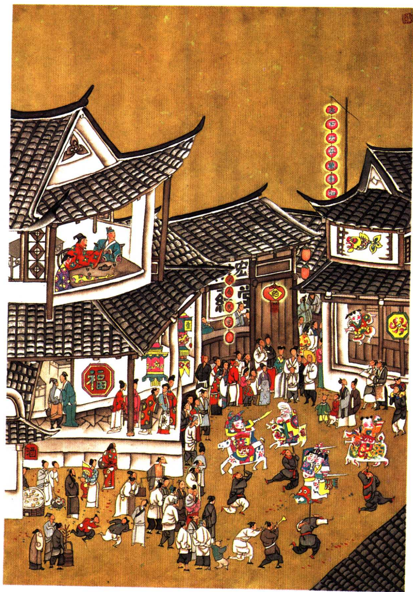
逞豪华门前放烟火