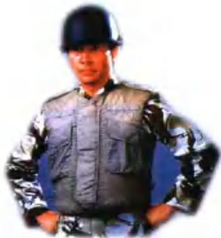
韩国开夫拉防弹背心