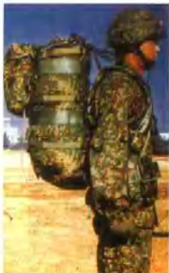
日陆军新一代迷彩作战服