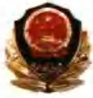
中国人民解放军军帽徽