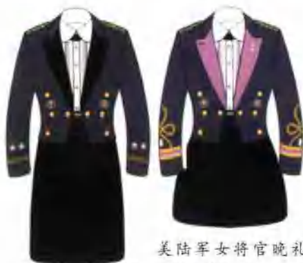
美陆军女将官晚礼服、女军官晚宴服