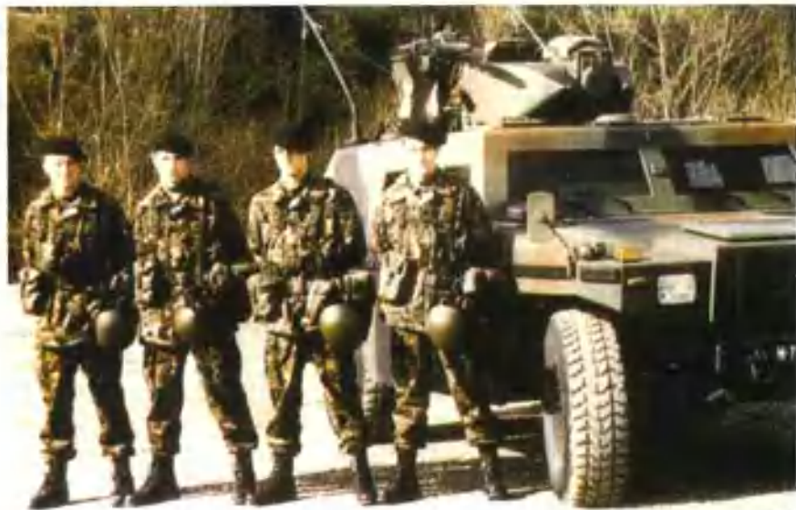
瑞士陆军林地迷彩作战服