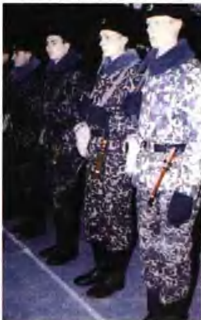
俄海军陆战队海洋色迷彩作战冬服