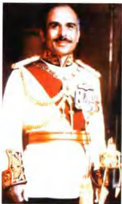
约旦武装部队司令大礼服