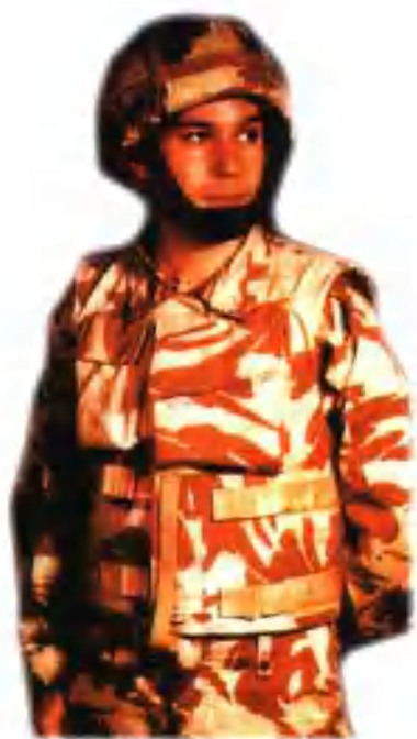
英国轻型防弹背心