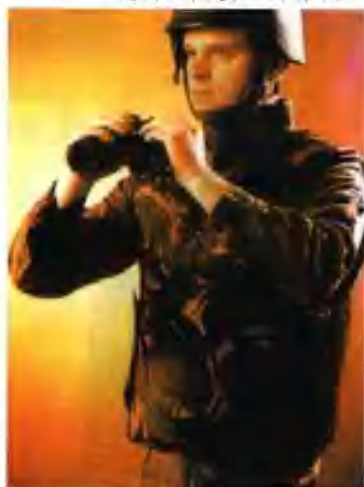
美国“开夫拉”防弹衣