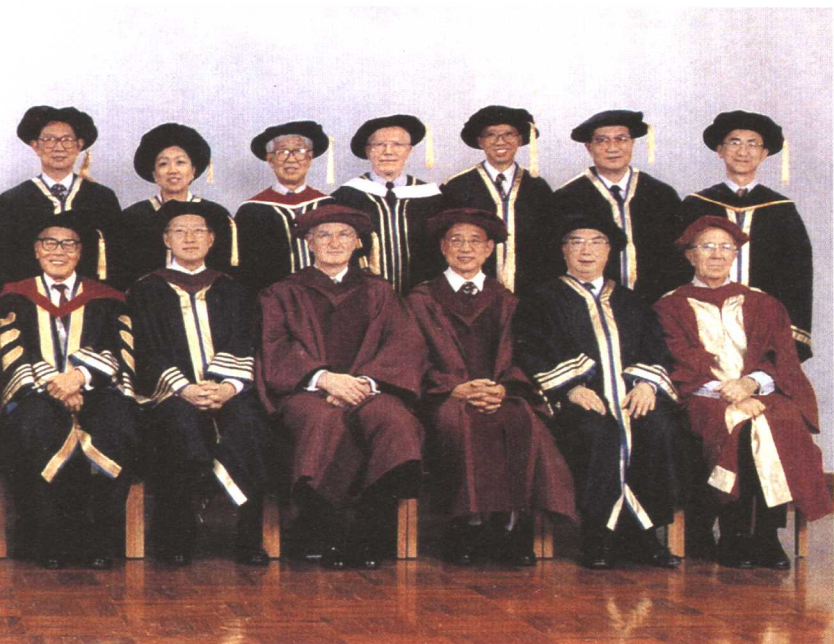
1997年，行政长官董建华与校董会成员在毕业典礼后与荣誉博士学位获得者合影。后排：（由左至右）林垂宙教授，丁邦新教授，高秉强教授，张立纲教授，黄至刚博士，王英伟先生，摩约克博士，卞汉生先生，史美伦女士，作者，卜谊隆先生，陈玉树教授，尤乃亭教授，雷明德教授；前排：（由左至右）陈南禄先生，麦蕴利爵士，谢志伟博士，葛守仁教授，潘国濂博士，吴家玮教授，行政长官董建华，钟士元议员，李国能博士，苏海文博士，沈元壤教授，刘华森博士，钟逸杰爵士。