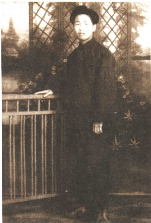
在上海学徒时的作者，1950年春摄于上海，时年十五岁。