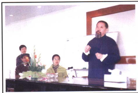
黄老师在南通发表演说,1998年春天