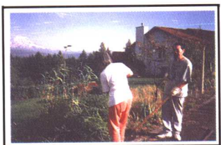
师生一块在道场出坡,1997年夏