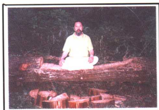
道场树林中是静坐的好地方