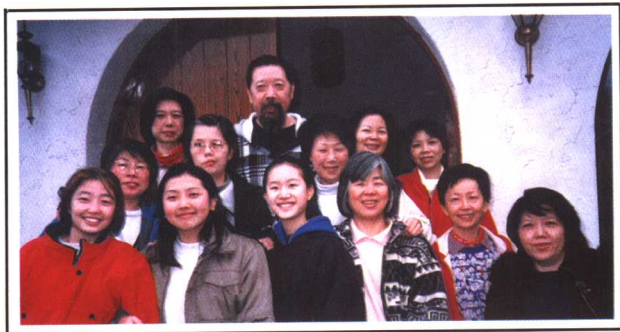
1996年12月和部分同学摄于讲堂大门