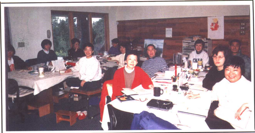
这是美国东山讲堂的课堂