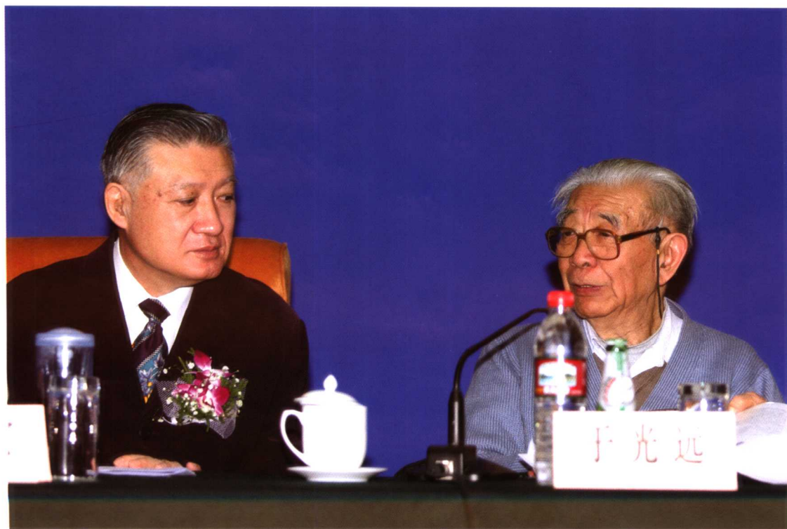
↑ 著名经济学家于光远先生与石滋宜博士交谈