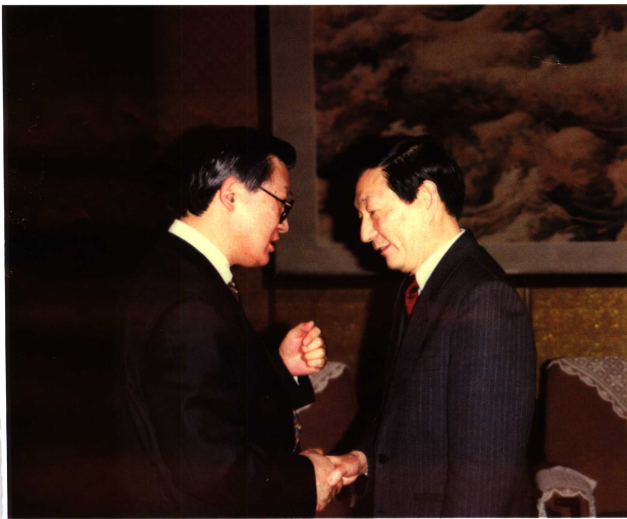
↑ 时任国务院总理的朱镕基同志接见石滋宜博士