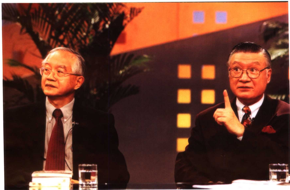
↑ 石滋宜博士与著名经济学家吴敬琏先生在央视《对话》栏目中为中小企业把脉