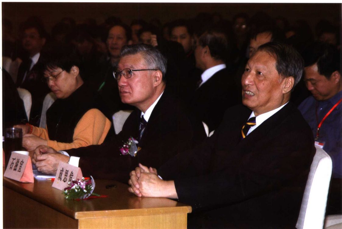
↑ 全国人大副委员长成思危同志与石滋宜博士在第13届《中外管理》官产学恳谈会上