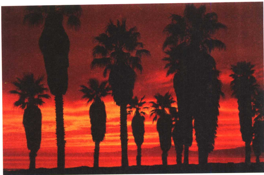
▮ 圣芭拉海边高大的棕榈树，在烈焰般的晚霞中的剪影。