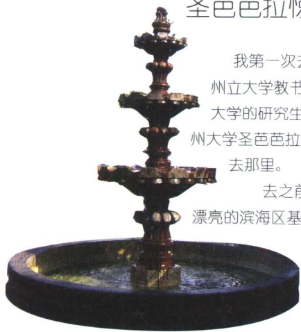
非常典型的西班牙建筑中庭。

从那次以后，我就经常去圣芭芭拉。之后也去西班牙、意大利南部、法国南部、葡萄牙，走遍了整个地中海的沿海，看到许多精彩的地中海建筑。在加利福尼亚沿海，佛罗里达沿海走得更多，但是基本可以说没有见过任何一个如此浓厚、集中、精彩绝伦的城市。要说到地中海风格建筑群，或者说加州风格城市，我一直认为圣芭芭拉才是首选，是第一位的。