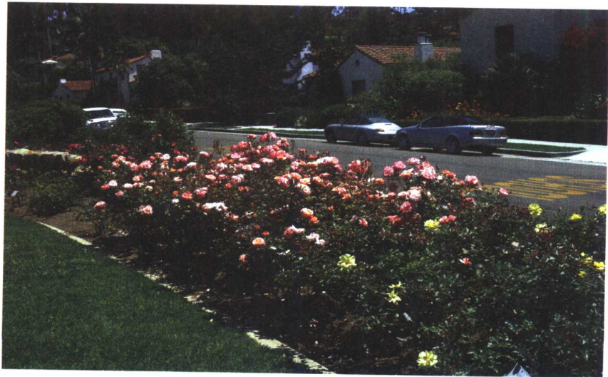
↘ 散落在青翠山谷中的民居。

对于每一个怀抱美好旅游梦想、向往别样风景、别样风情的人来说，在欧洲，地中海、波罗的海都是美妙的乌托邦般的梦境。随便从书上撕下的一页地中海图片，都是那样令人心驰神往。地中海的优美是如此容易地贴近人们的心灵空间，不要说能住在地中海，就是闭目冥想一下都觉得有莫大的吸引力。