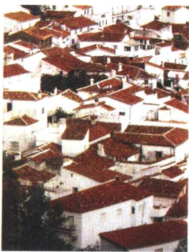
地中海边满山遍野的红瓦白墙小住宅，叹为观止。

记得是去年夏天的一个下午，我正在上海一家庞大的房地产公司开会。无独有偶，我们也正在讨论项目的风格控制，好像也有西班牙风格的项目。开了整整一下午会议，实在很忙，会中不断有人打电话给我，说要过来看我。电话打了好几次，是无锡的那个开发商。那天我忙得有点发疯了，告诉他们我的时间很少，他们还是坚持要来，说时间不需要太多，是关于请我写本书的事情，大约就1个小时吧。我告诉他们，我当天晚上也有约，不能够陪他们吃饭，他们还是从无锡动身了。等我开完几个小时的会，他们也就到了。在我下榻的衡山路附近的一家大酒店的咖啡座等我，带了一些资料给我看。