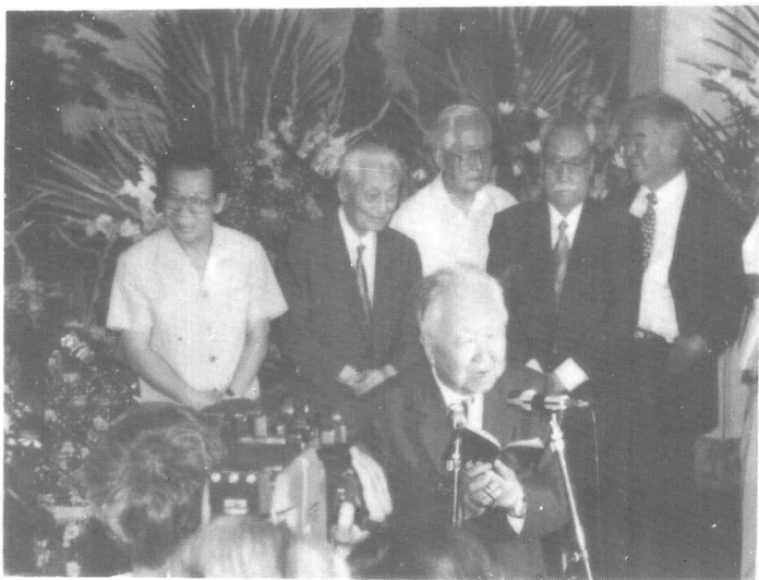
为庆贺著名书法家我校启功教授执教六十周年和他八十寿诞，我校与全国政协等单位共同发起举办启功书画展，中共中央政治局常委李瑞环前来祝贺并剪彩。