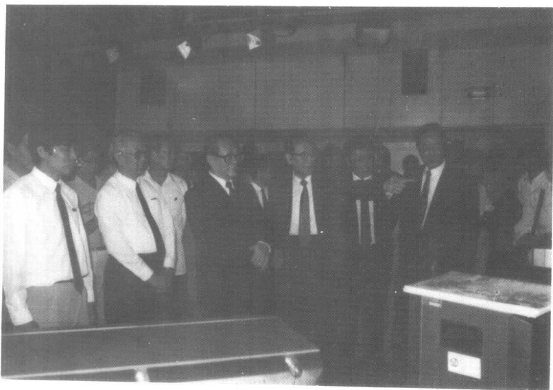
1992年9月9日，江泽民总书记在我校教育技术中心观看远距离通讯系统和电脑视频创作系统。