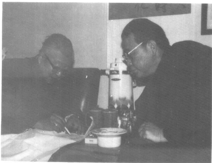
李鹏总理在我校中文系启功教授家中切磋书法。