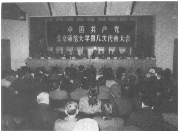
1992年2月22日，我校第八次党代会在英东楼学术会堂隆重开幕。图为大会会场。