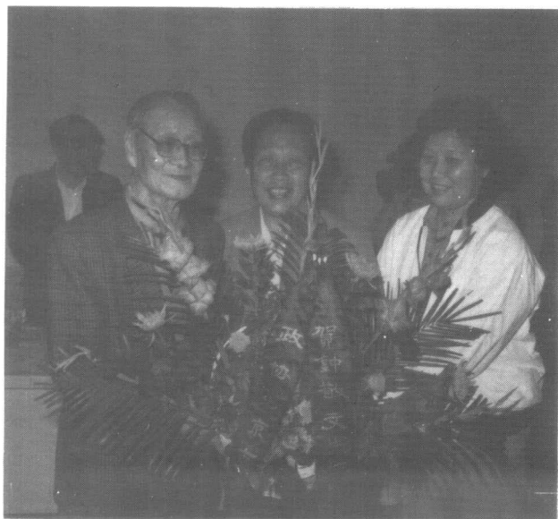
1992年9月26日，我校举行钟敬文学术活动七十周年座谈会。中国民俗学、民间文学运动的开创者和奠基人，著名教育家、诗人和散文家，我校中文系教授钟敬文先生在英东楼接受了他的学生们的情祝福。