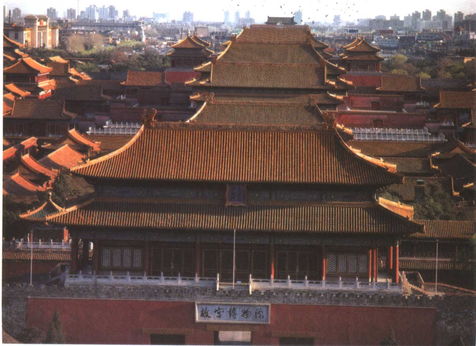
gù gōng bó wù yuán 故宫博物院

běi jīng gù gōng jiǎn chēng gù gōng shì míng qīng liǎng cháo de huáng gōng zài dāng shí 北京故宫，简称故宫，是明清两朝的皇宫，在当时 bèi chēng wéi zǐ jìn chéng tā shì míng cháo huáng dì zhū dì zhēng diào wú shù néng gōng qiǎo jiàng 被称为紫禁城。它是明朝皇帝朱棣征调无数能工巧匠， yòng le nián nián shí jiān jiàn chéng de hóng wēi jiàn zhù gù gōng zhàn 用了14年(1407~1420年)时间建成的宏伟建筑。故宫占 dì 72 wàn píng fāng mǐ gòng yǒu fáng wū jiǔ qiān duō jiān shì quán shì jiè guī mó zuì dà 地72万平方米，共有房屋九千多间，是全世界规模最大、 bǎo cún zuì wán hǎo de gǔ dài huáng gōng jiàn zhù qún gōng diàn yán zhe yī tiáo nán běi zǒu 保存最完好的古代皇宫建筑群。宫殿沿着一条南北走 xiàng de zhōng zhóu xiàn pái liè zuǒ yòu duì chèn bù jú yán zhěng cóng nián míng cháo 向的中轴线排列，左右对称，布局严整。从1421年明朝