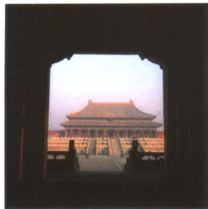
gù gōng 故宫

dì lǐ wèi zhì zhōng guó běi jīng shì zhōng xīn 地理位置 中国北京市中心