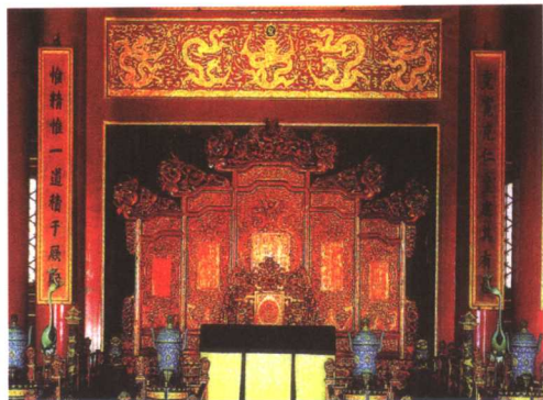
zhè ge rì guī shì gù gōng xiàn cún zuì gǔ 这个日晷是故宫现存最古 lǎo de jì shí qì 老的计时器。

zhóu xiàn shàng sì zhōu yǒu hàn bái 轴线上，四周有汉白