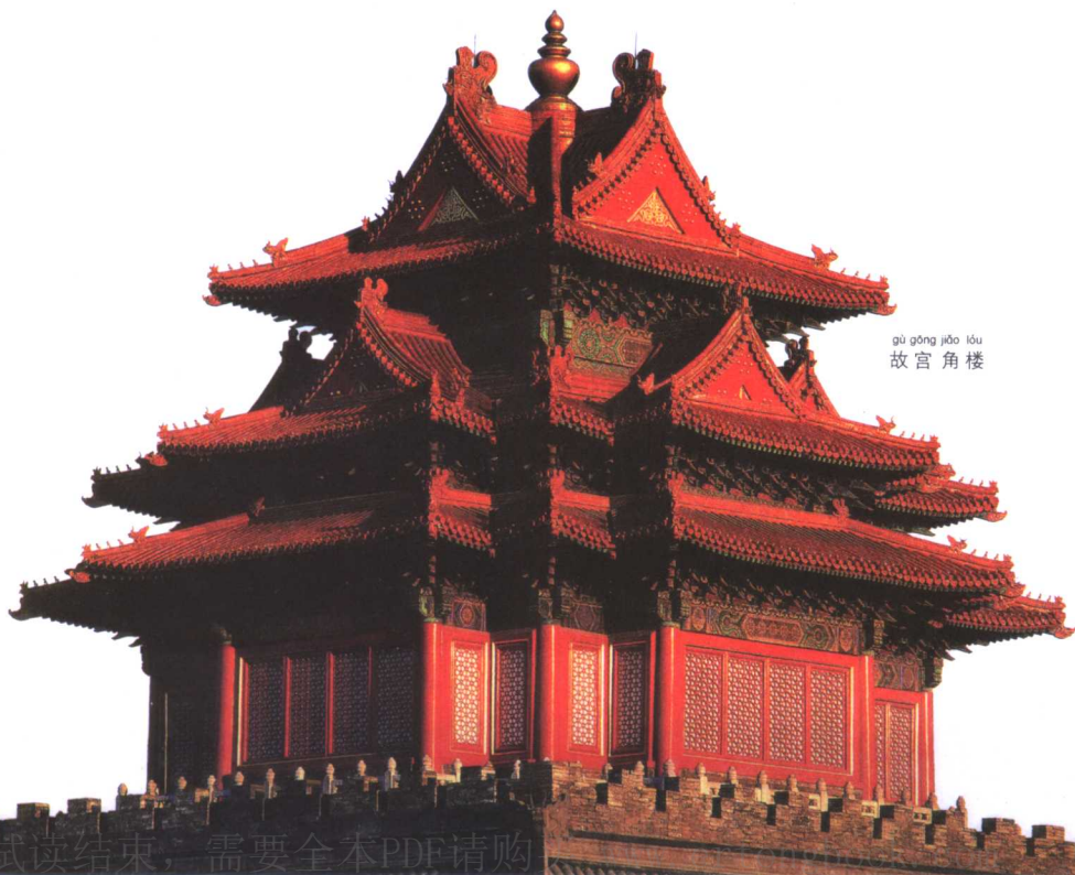
gù gōng jiǎo lóu 故宫角楼