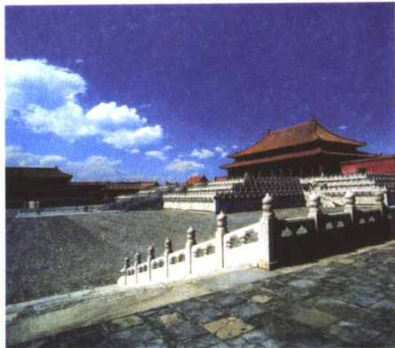
tài hé diàn 太和殿

wù dōu shì jué wú jǐn yǒu de wú jià zhī bǎo 物都是绝无仅有的无价之宝。