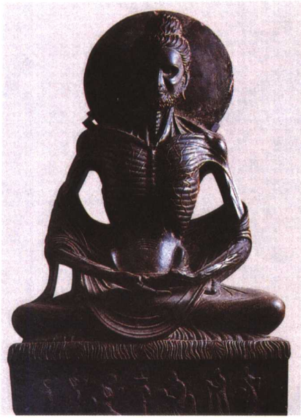
图版二 石雕释迦牟尼 禅定像（在巴基斯坦白沙瓦 博物馆）