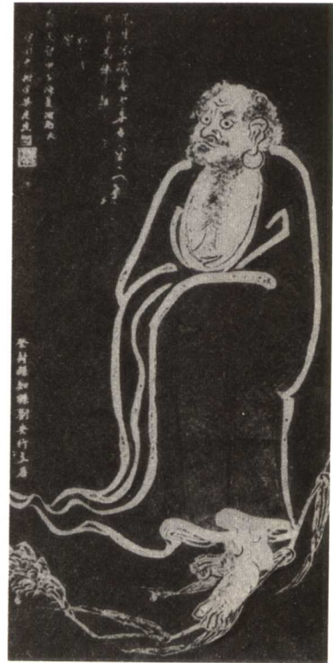
图版三 石刻菩提达磨像 （在西安碑林）