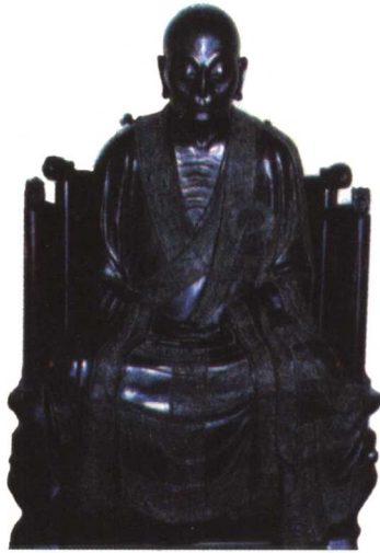
图版四 六祖慧能铜像（北宋初铸，在广州六榕寺）