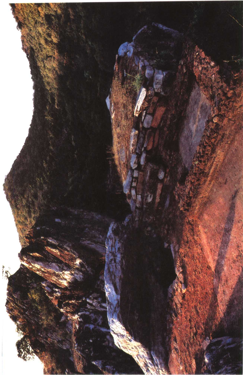
图版一 灵山香堂遗址（在印度王舍城外）