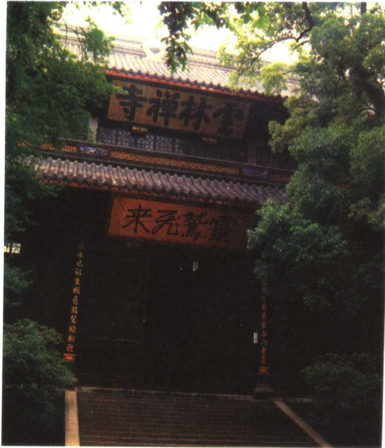
图版五 杭州灵隐寺