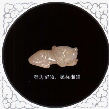
嘴边留须，属标准猫

白玉质，纯正，具宝光，约一级仔儿白玉。随形雕，整体雕猫，工精细，神态形象。市面较少见。