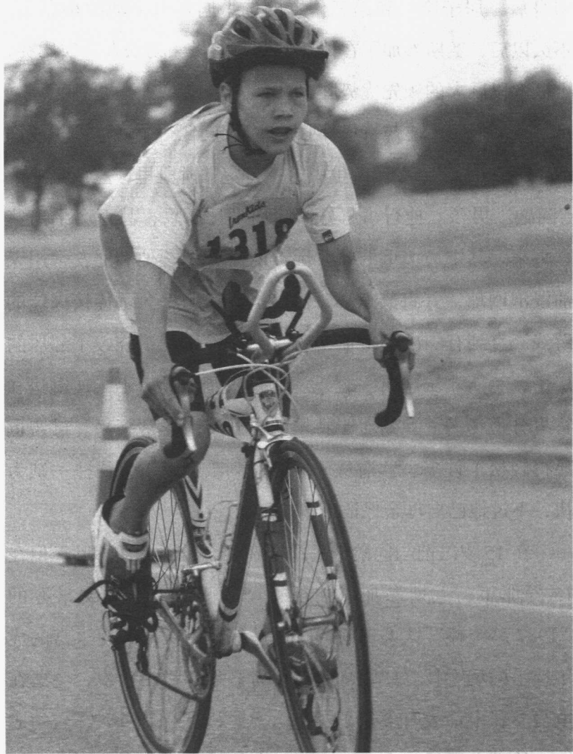
兰 斯 · 阿 姆 斯 特 朗