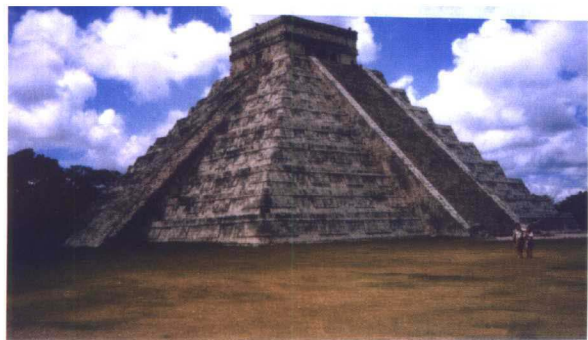
玛雅文化遗址——奇琴伊查 库库尔坎金字塔