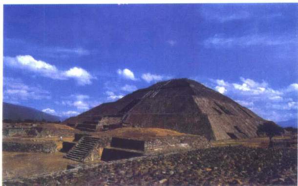
特奥蒂瓦坎太阳金字塔