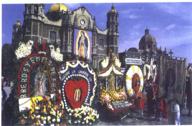
瓜达卢佩圣母教堂