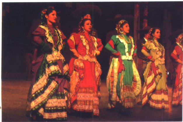
热情奔放的民间舞蹈