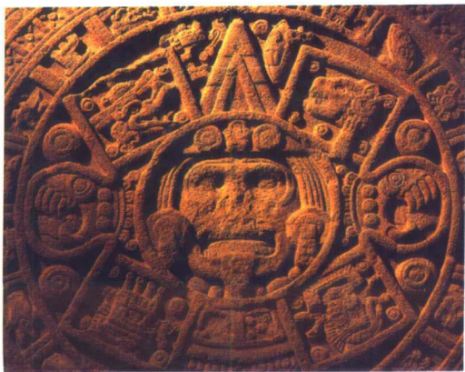
阿兹特克日历——太阳石