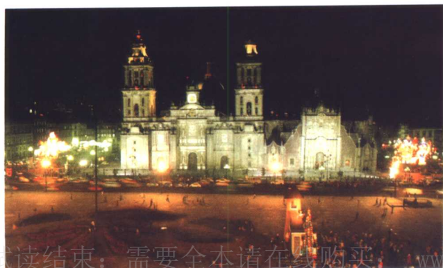
墨西哥城索卡诺广场夜景