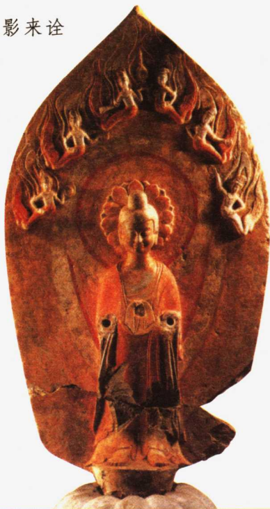
→ 山东青州背光鎏金 菩萨雕像（南北朝）