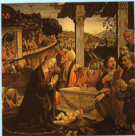
彩图十二 《耶稣诞生》，吉兰达约(Chilandajof[意]1449~1494) (释文见正文 460 页)