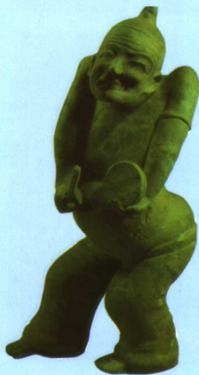
彩图三 东汉立式说唱俑 (释文见正文 128 页)