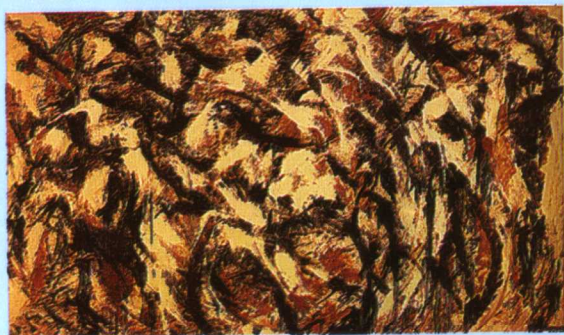
彩图六 《极地猛冲》，克瑞森尔(L.Krasner[美]1911~1984) (释文见正文 299 页)