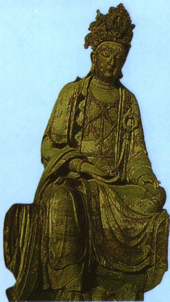
彩图十四 北宋弥勒菩萨 (释文见正文 461 页)