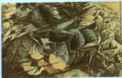
彩图五 《冲锋长矛手》，勃其奥尼(U.Boccioni [意]1882~1916) (释文见正文 299 页)