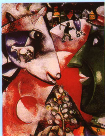
彩图七 《我与村庄》，夏加尔 (M.Chagall[俄]1887~1985) (释文见正文 328 页)