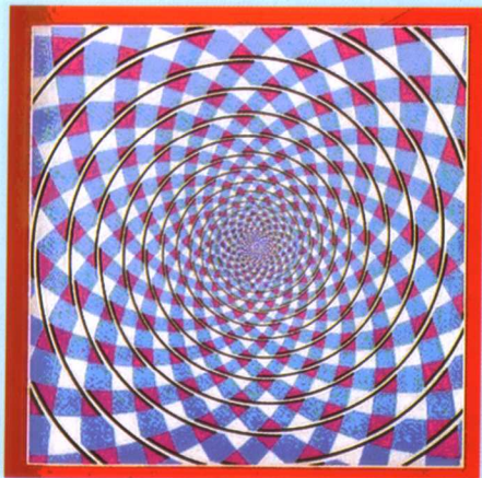
彩图一 是同心圆还是螺线？ (释文见正文 103 页)