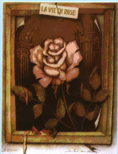
彩图二 是玫瑰花还是情侣？ (释文见正文 115 页)