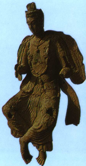
彩图十一 西魏佛象 (释文见正文 460 页)