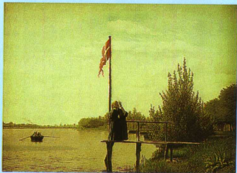
彩图四 《哥本哈根的湖泊》，柯勃克 (C.Kobke[丹]1810~1848) (释文见正文 299 页)