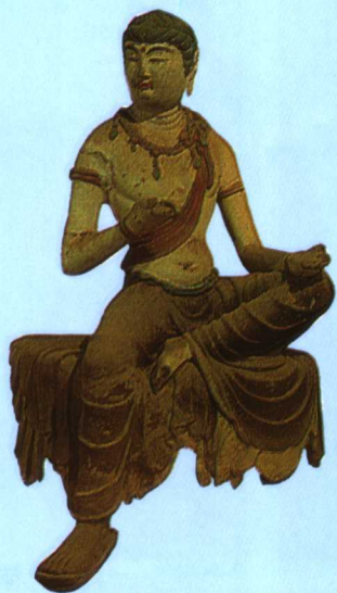
彩图十 盛唐佛象 (释文见正文 460 页)