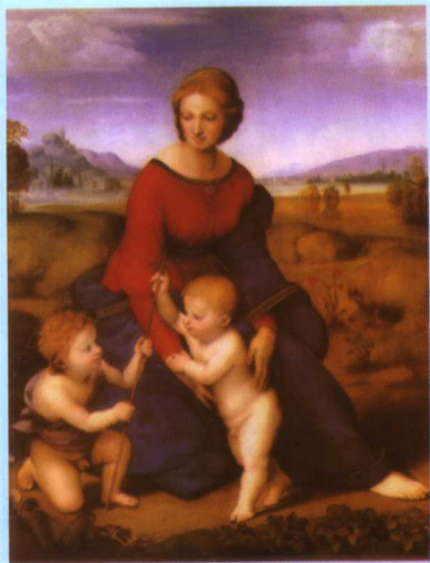
彩图十三 《草地圣母》，拉斐尔 (Raphael[意]1483~1520) (释文见正文 460 页)