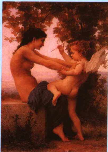
彩图九 《抗拒爱神的少女》，布格罗(W.Bouguereau[法]1825~1905) (释文见正文 331 页)