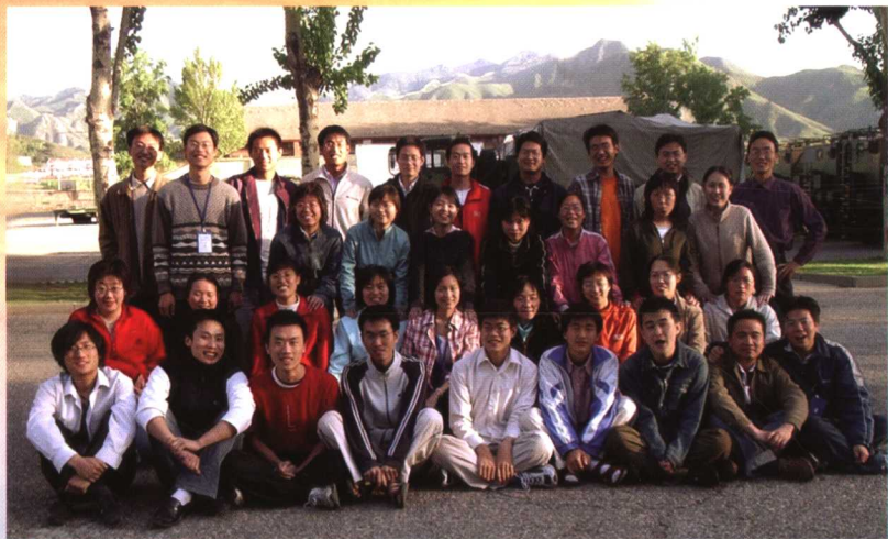
创作“乡土·乡亲”三农科普丛书的大学生