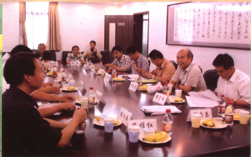
专家们讨论审读和修改丛书书稿的方案