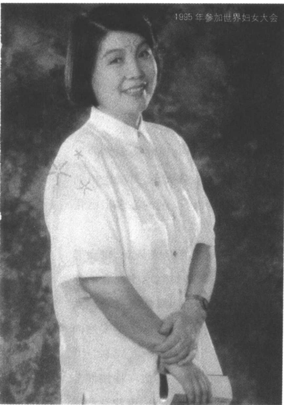
1995年参加世界妇女大会