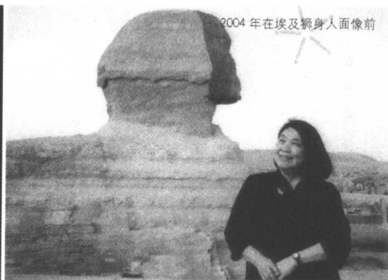
2004年在埃及狮身人面像前