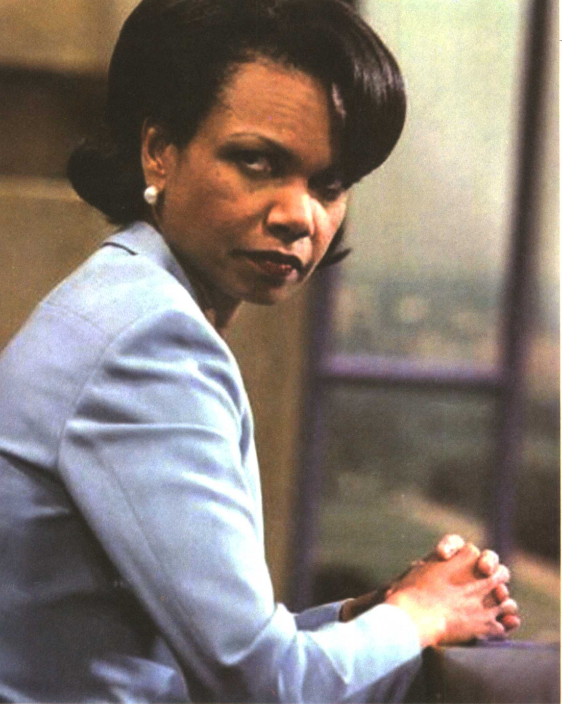
■ 创造历史的黑人女国务卿——康多莉扎·赖斯