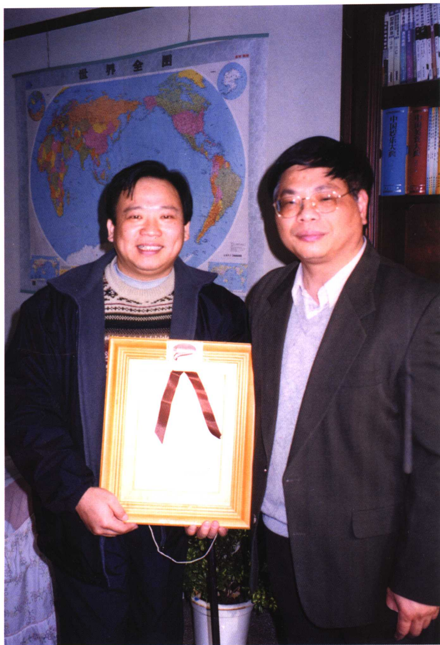
中国残疾人联合会党组书记王新宪听取王谦汇报并与其合影留念