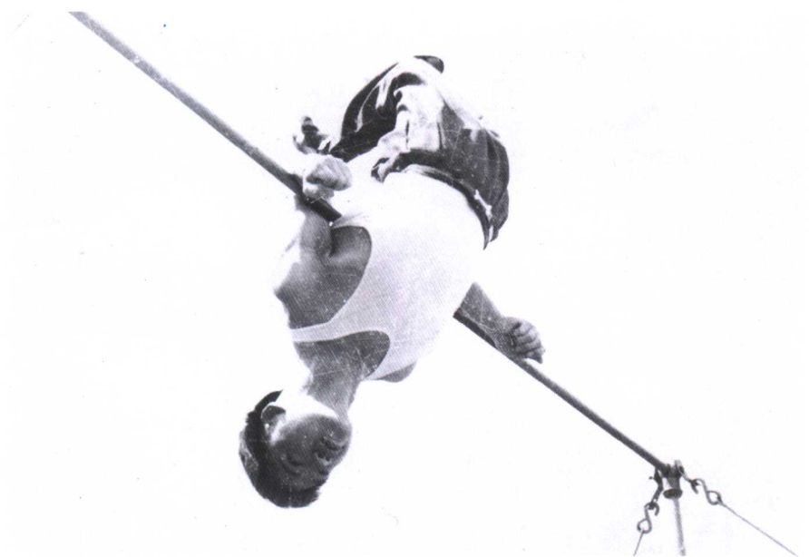
不安分的我——摄于1974年