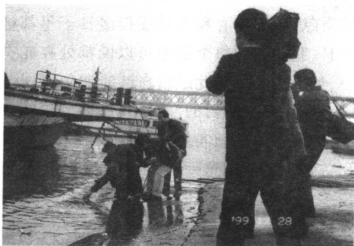
神圣的取土取水仪式