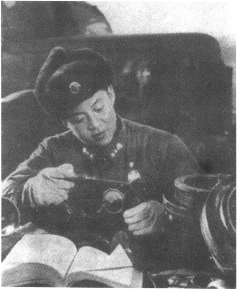
伟大的共产主义战士——雷锋