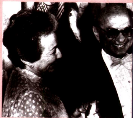
弗里德曼在诺贝尔奖典礼上（1976年）