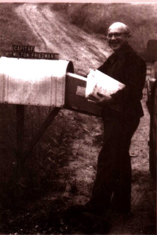
弗里德曼在“卡皮塔夫”取信（大约于1975年）