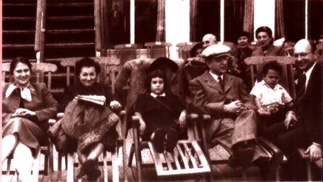
弗里德曼一家与阿瑟·伯恩斯、海伦·伯恩斯在去欧洲的船上（1950年）