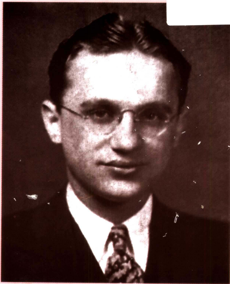
从罗杰斯大学毕业(1932)