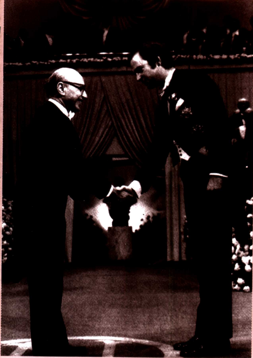
弗里德曼夫妇在诺贝尔奖 典礼舞会上（1976年）