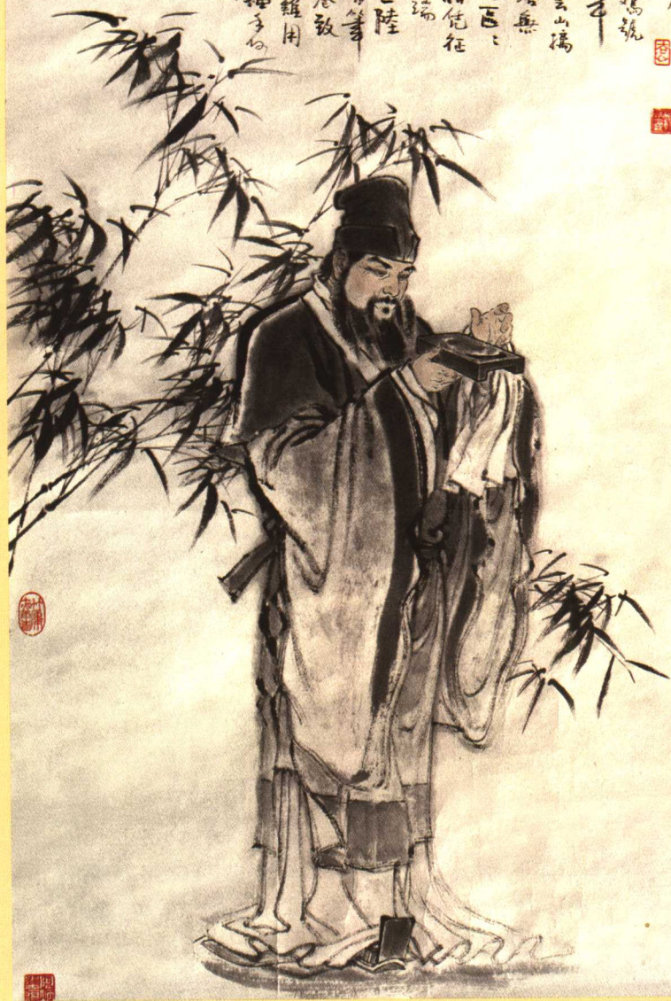
沁園春（孤館燈青）詞意圖 顧炳鑫繪