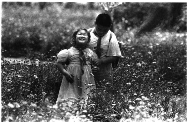
福利院的孩子和盲孩子