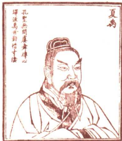
禹：传说中上古夏后氏首领，曾因治水立下大功。后接受舜的禅让，即天子位，国号“夏”，史称夏禹。

揭器求言，是夏禹了解民情、征求意见的特有方式。“前来指教我治国之道的人，请击鼓；前来告诉我处事方法的人，请撞钟；前来向我反映情况的人，请振铎；前来向我诉说忧虑的人，请敲磬；前来告状诉讼的人，请摇鞀。”和帝尧时“置谏鼓、立谤木”相比，分类更加细致，指向性也更加明确了。