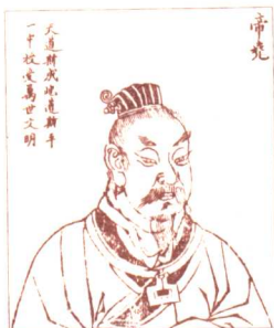
帝尧：中国古代传说中的“五帝”之一。据说名字叫放勋，因曾为陶唐氏首领，历史上又称他为唐尧。

天下事，可以只由一个人说了算，却不可能只靠一个人治理好。个人的能力再强，即使像尧、舜这样圣明的君主，也必须依靠贤臣的辅佐才能成功。后人常说尧、舜无为而天下治，实际上是因为他们用人得当啊。