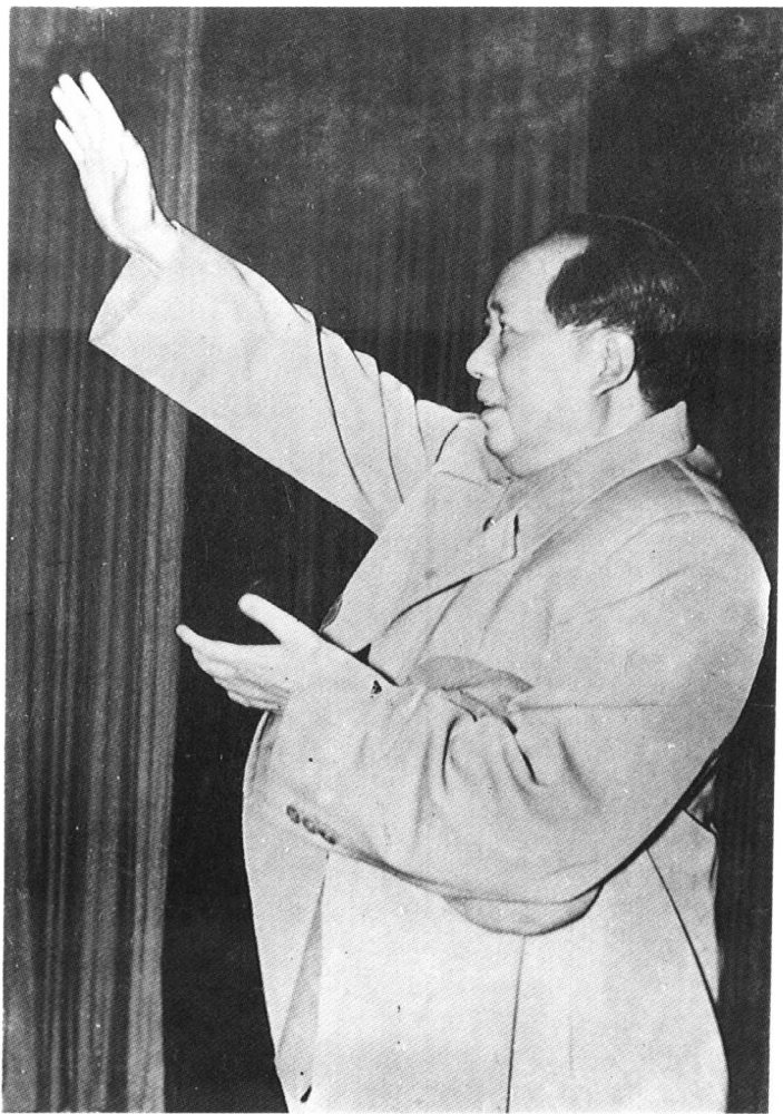
1958年11月12日，毛泽东在河南省军区礼堂接见中共河南省军区第一届第二次代表会议全体代表和省直机关干部，毛泽东向大家招手致意。