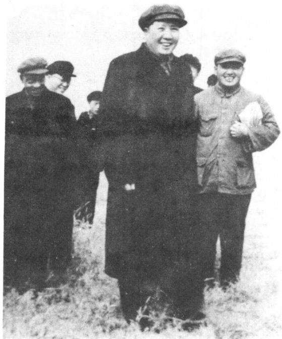
1952年10月30日下午，毛泽东在开封市郊柳园口视察黄河（上）。