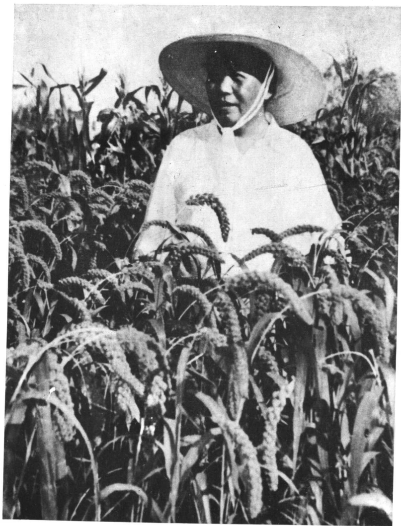
1958年8月7日上午,毛泽东视察襄县农村。