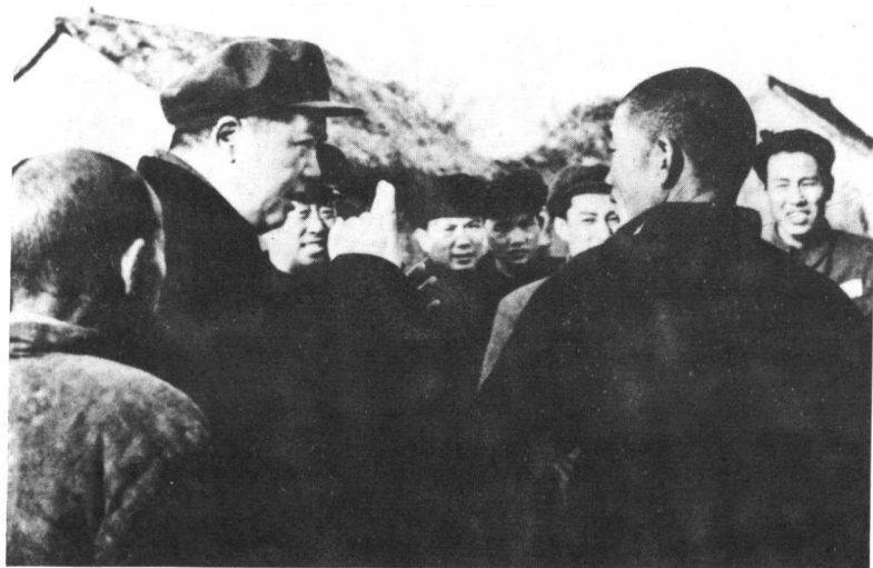
同日毛泽东在兰封（今兰考）县许贡庄同农民交谈（下）。