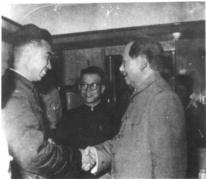
1958年11月1日,毛泽东在新乡车站专列上接见新乡地委及县委书记,这是毛泽东同林县县委书记杨贵握手。