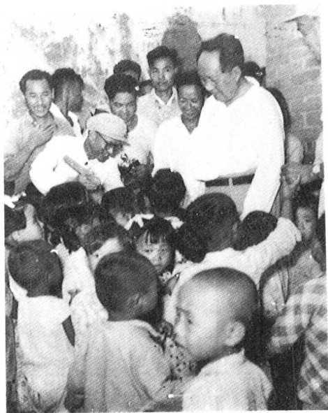
上图为1958年8月6日，毛泽东在新乡县七里营看着丰收在望的棉田十分欣喜。 1958年8月6日，毛泽东在七里营视察农村幼儿园（下）