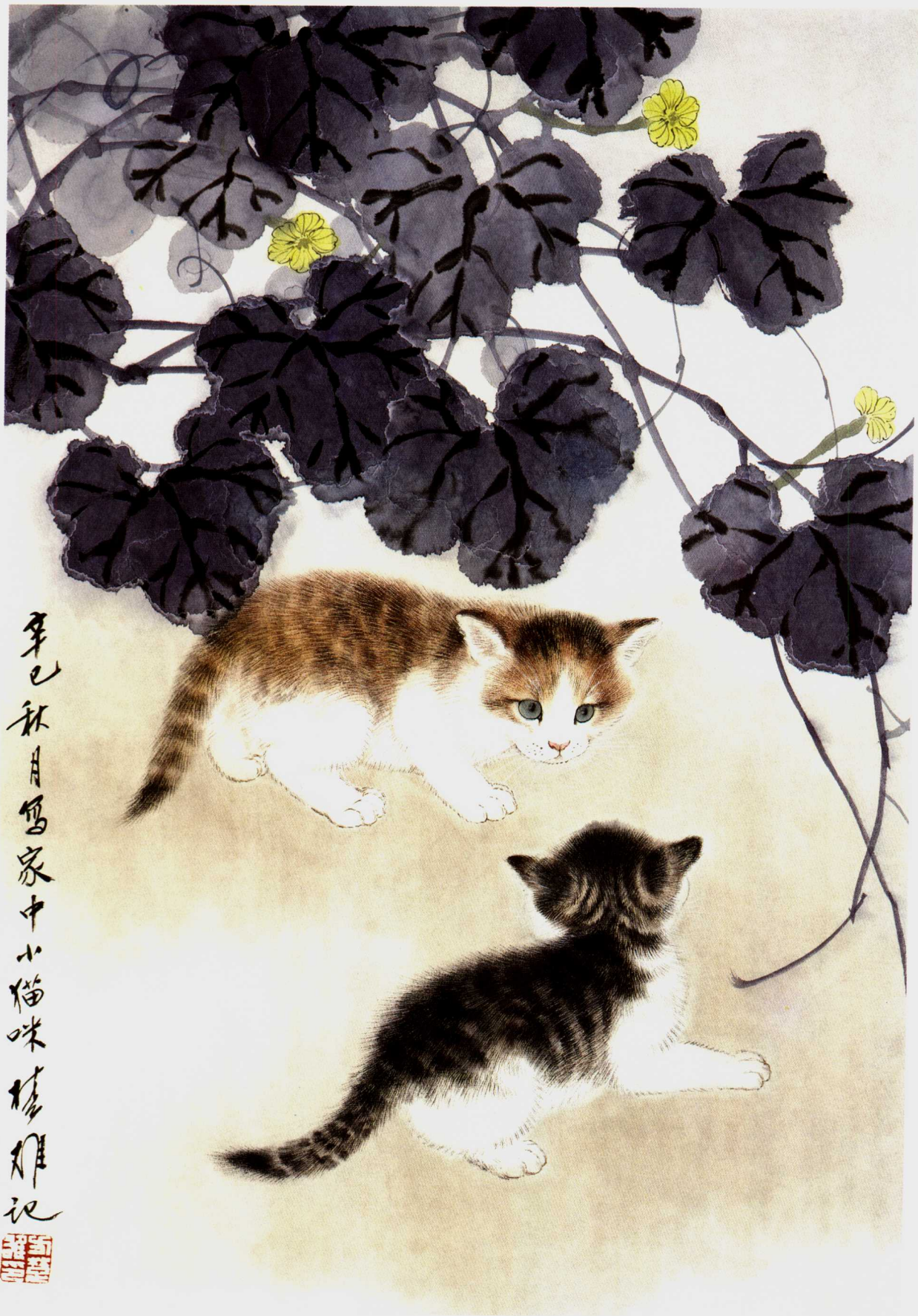
瓜荫戏猫 67 × 46cm 2001