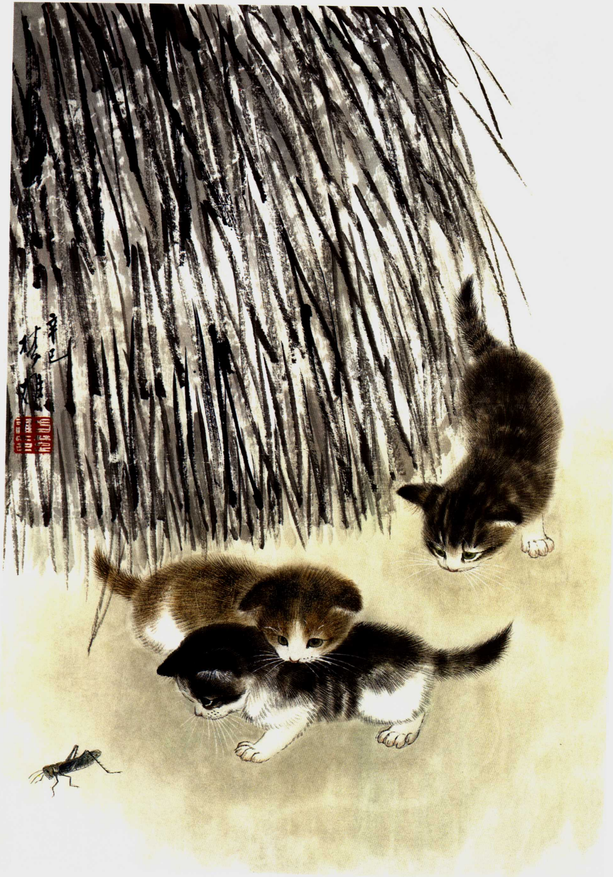
乡间小猫 65.6 × 45.6cm 2001