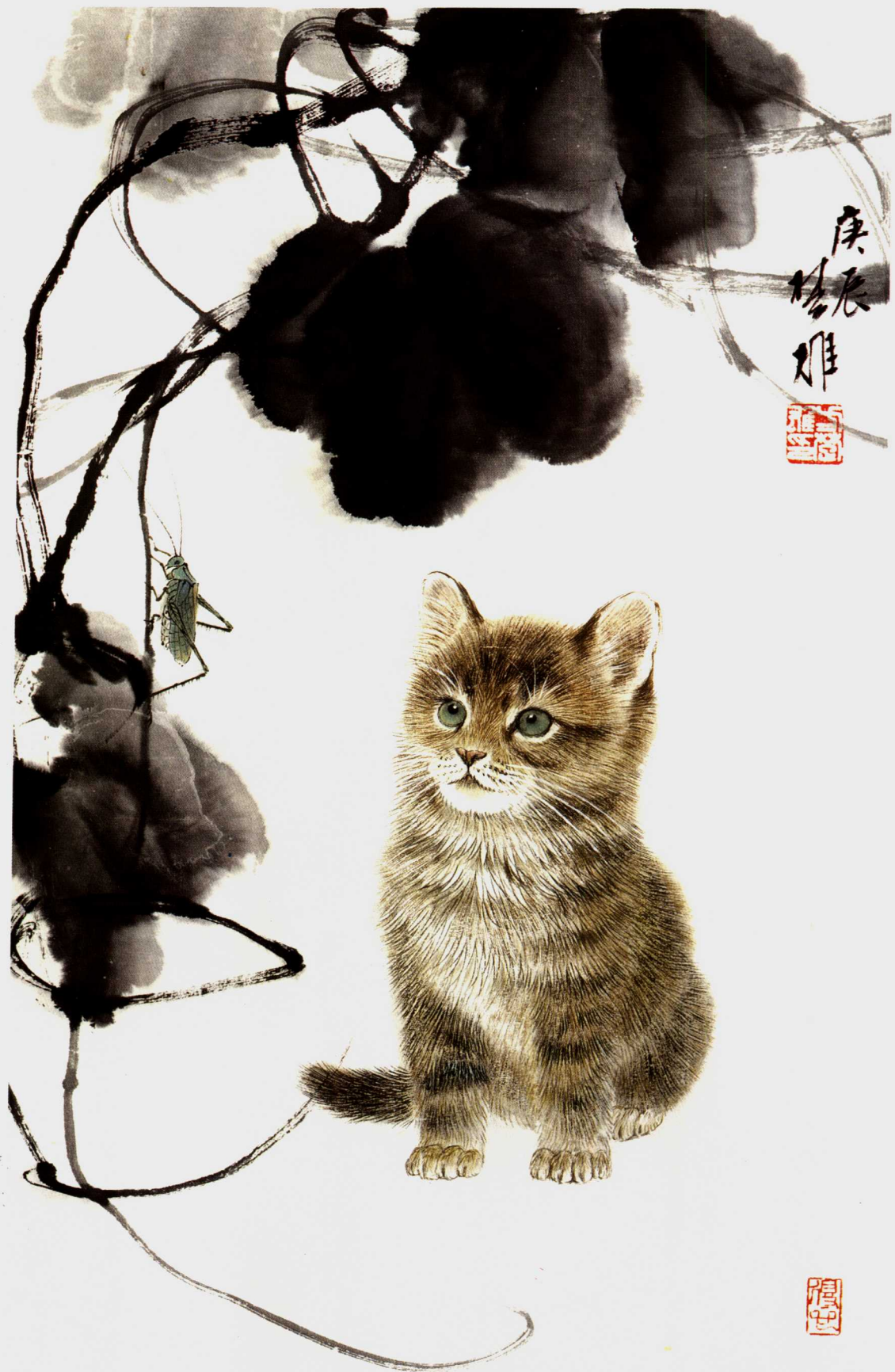
凝視 45.5 × 28cm 2000