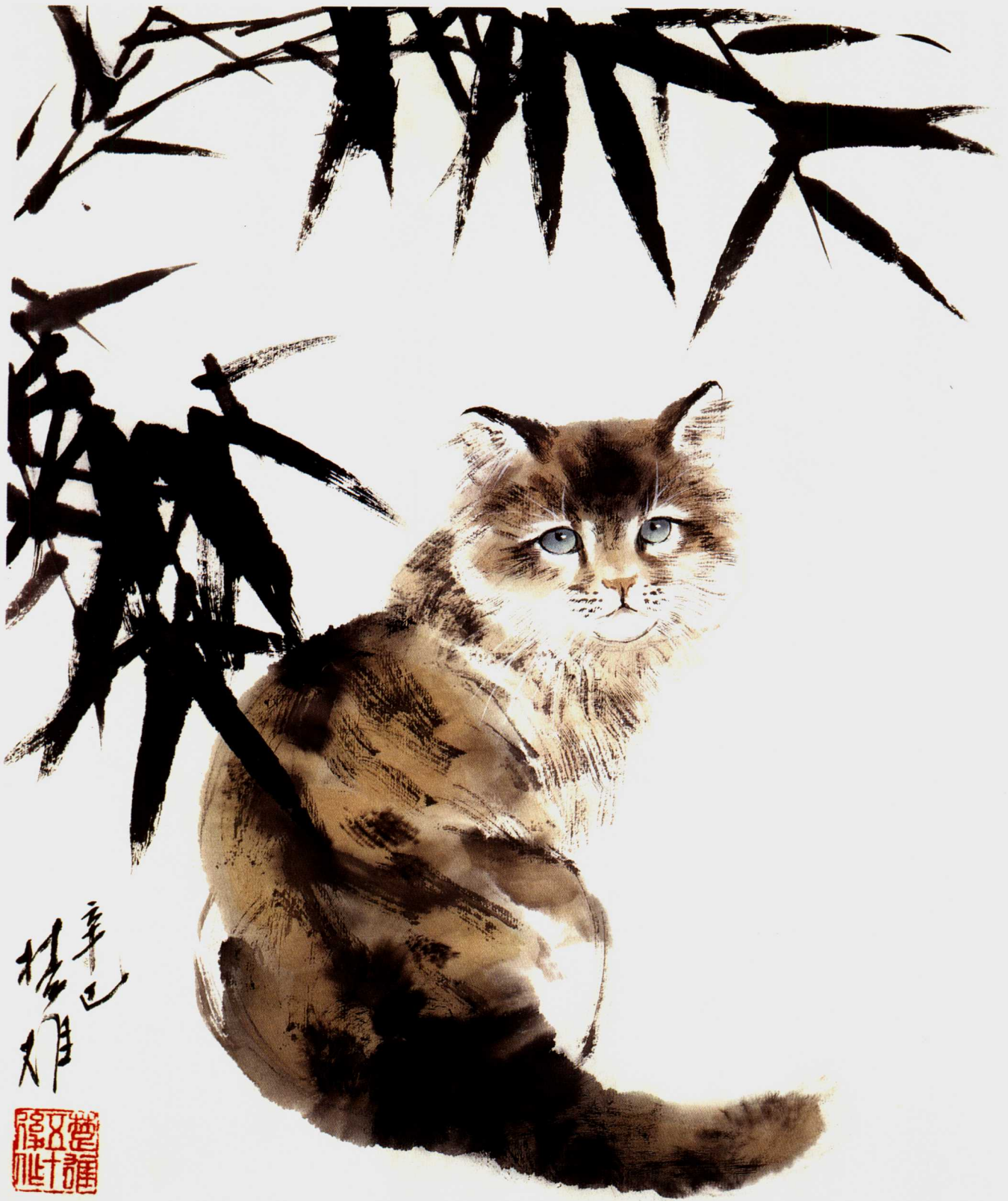
回头一顾 47 × 35cm 2001