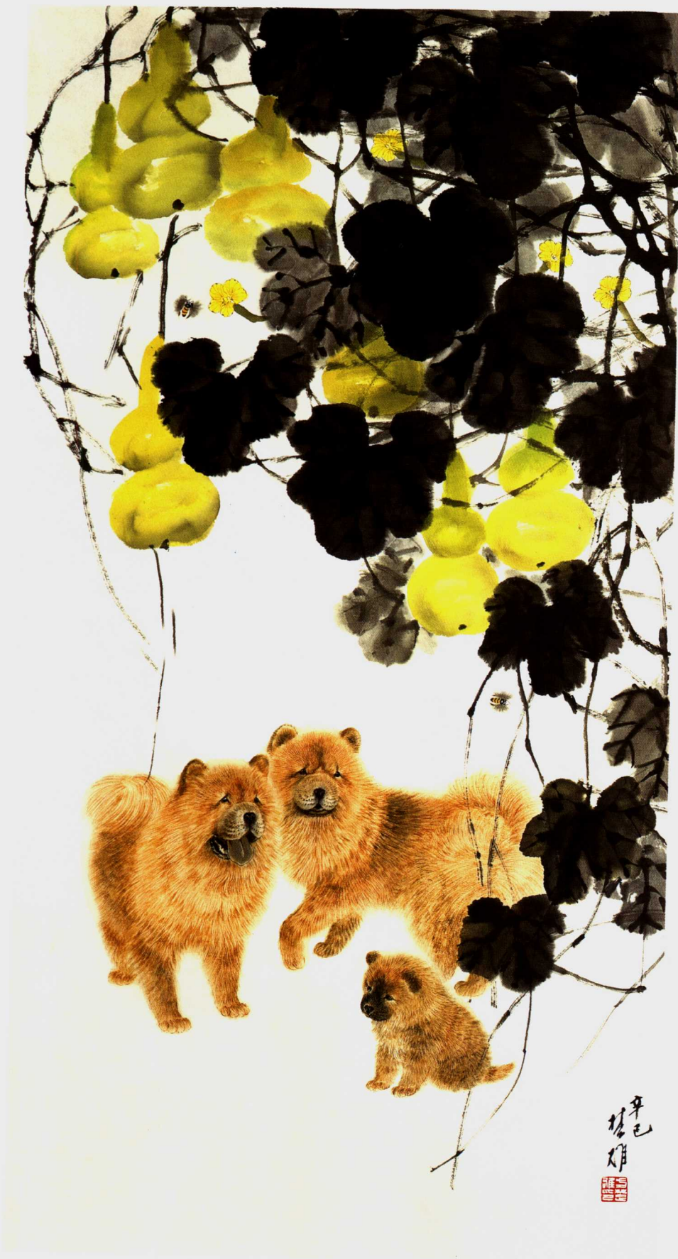
农家乐 138 × 70cm 2001