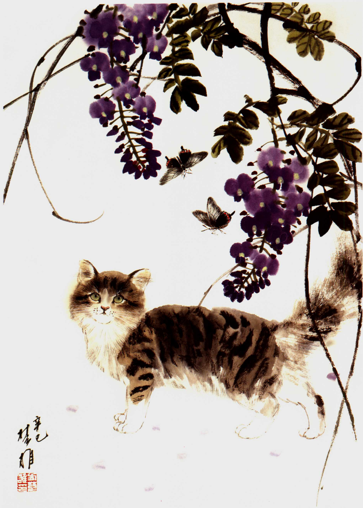
藤花猫蝶 70 × 46cm 2001