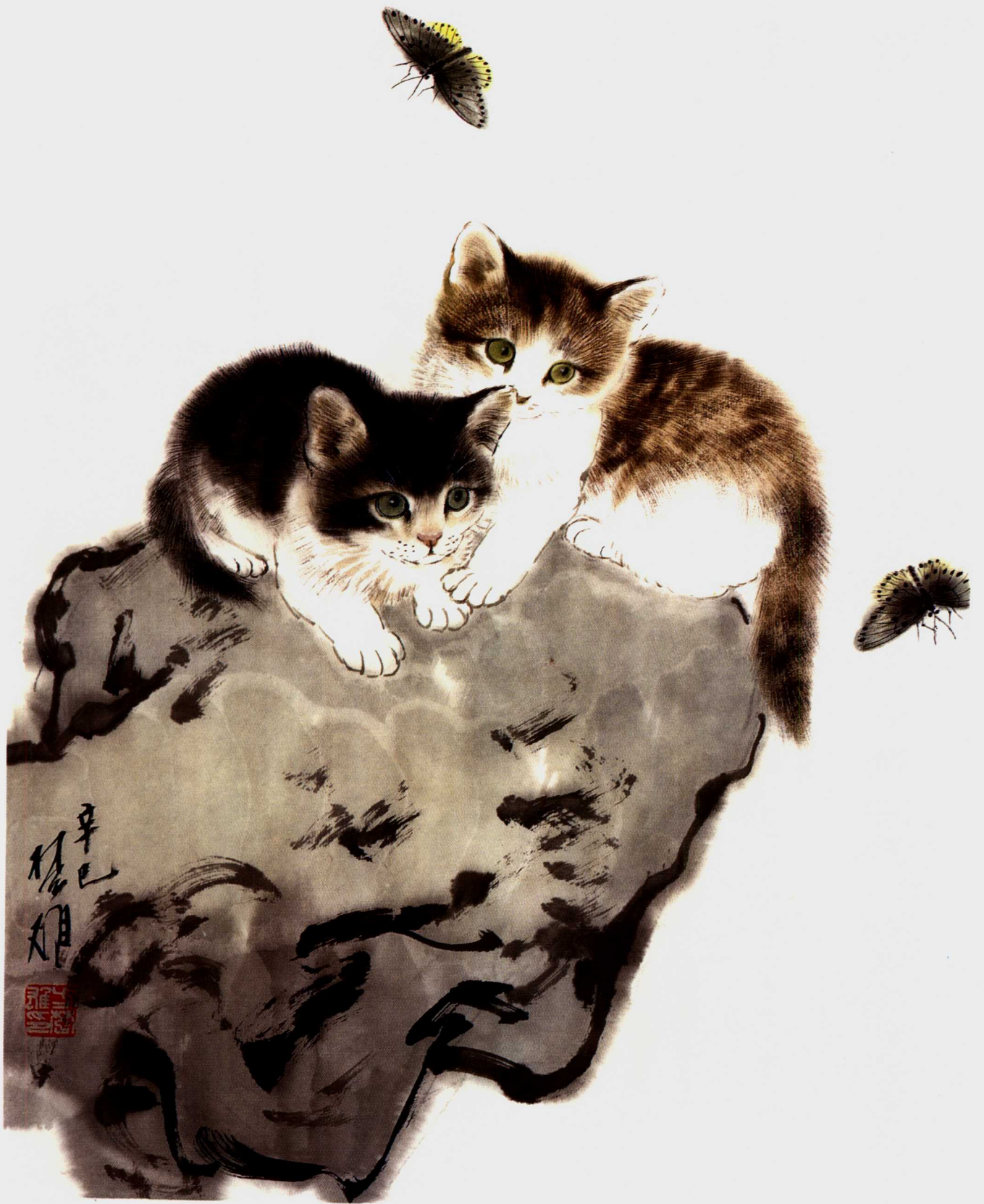
猫蝶图 47 × 35cm 2001