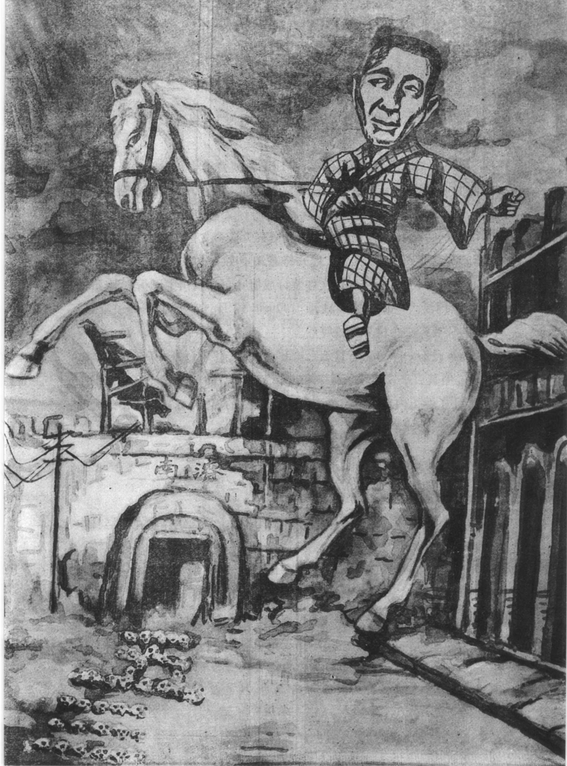
日本帝国主义铁蹄下的济南(1928年9月中央画报《五三惨案专号》)