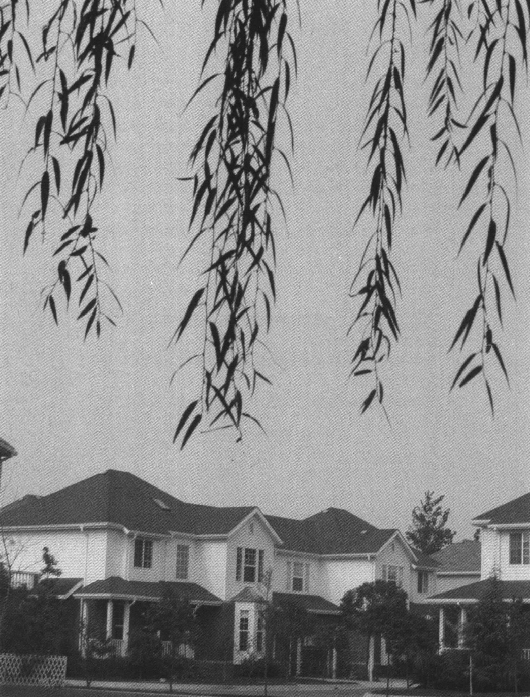
德胜(苏州)洋楼有限公司所在地波特兰小街一角