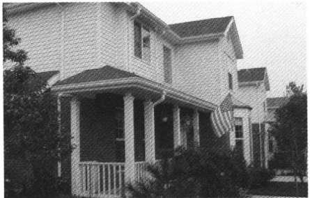
波特兰小街是德胜(苏州)洋楼有限公司 总部所在地