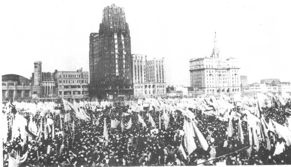
上海市召开10万人大会，声讨美国侵略朝鲜的罪行。