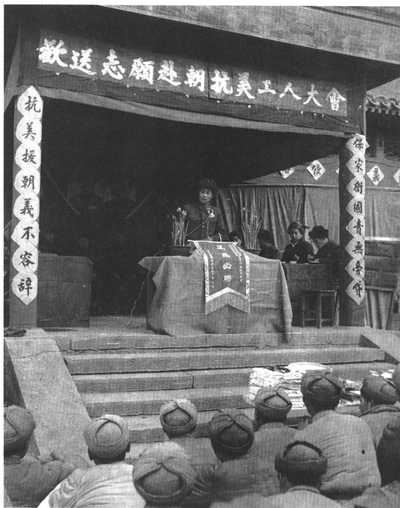
全国军民纷纷要求赴朝参战。这是某汽车修理厂召开大会，欢送志愿赴朝参战的青年工人。