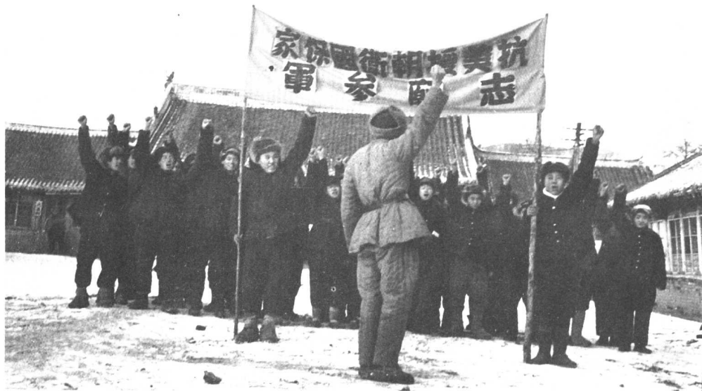
参加志愿军的青年农民宣誓。