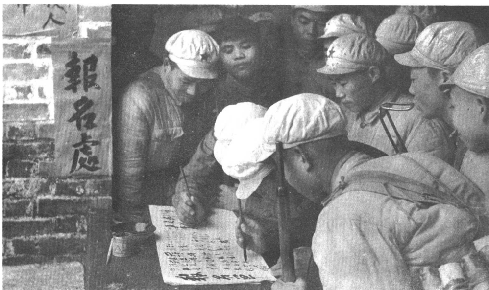
解放军战士踊跃报名，要求参加志愿军赴朝参战。