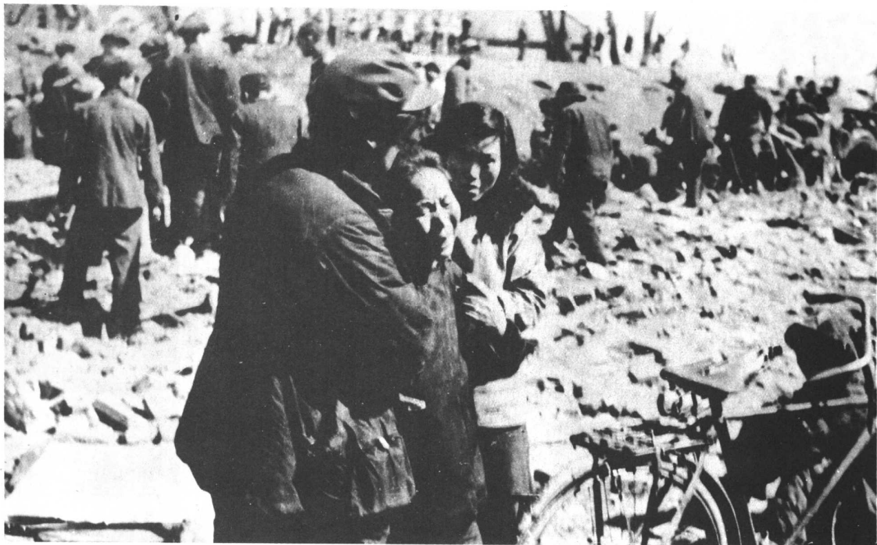
美国空军轰炸我国边境城市安市（今丹东市），这位老太太一家有七口人被炸死。