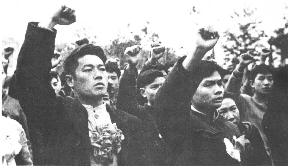
青年学生志愿赴朝参战。