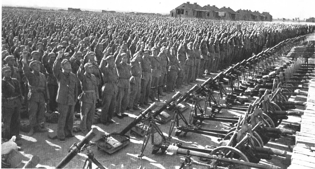
解放军某部指战员宣誓：抗美援朝，保家卫国，把美国侵略者赶回去。