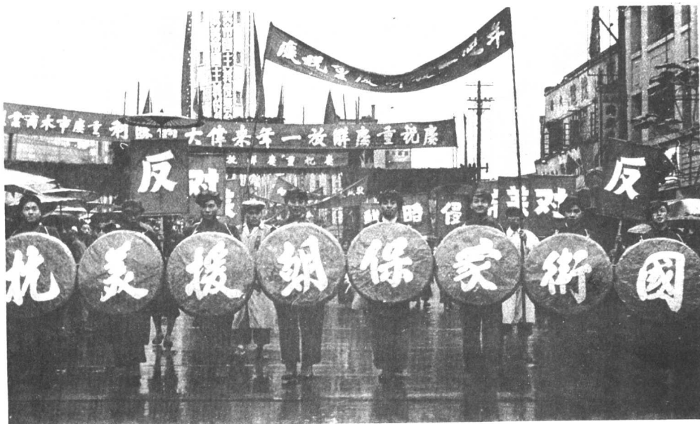
重庆市人民纷纷走上街头进行示威游行。