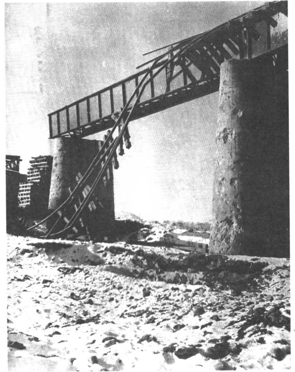
被炸坏的北方铁路大桥。