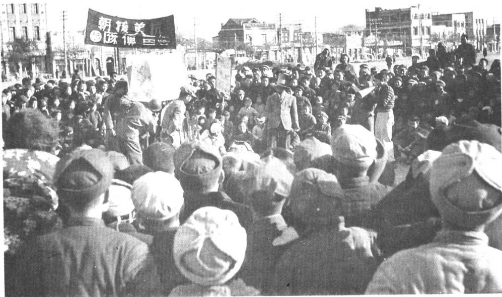
北京大学抗美援朝宣传队在北京东单广场进行宣传活动。