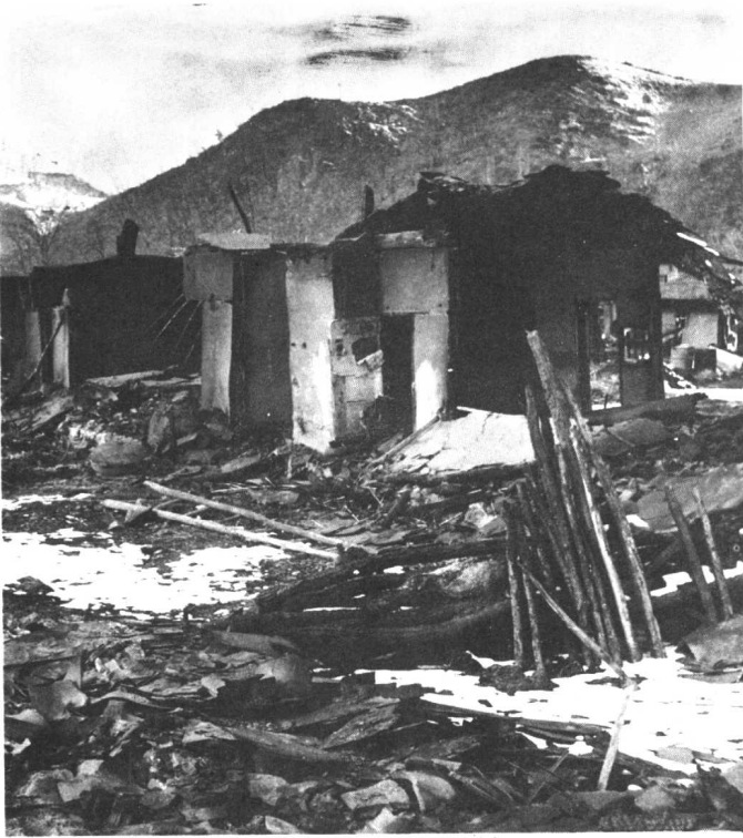
江界市被炸成一片废墟。