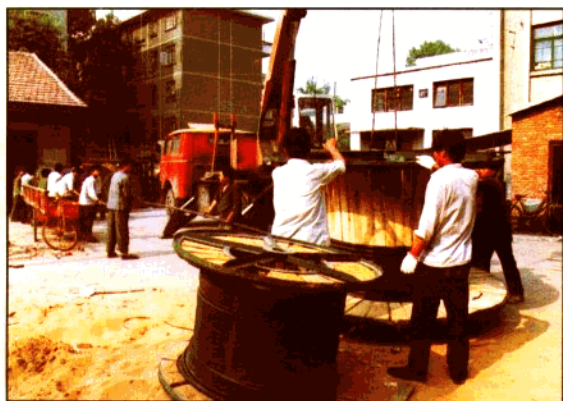
市话线路会战做到一户一线