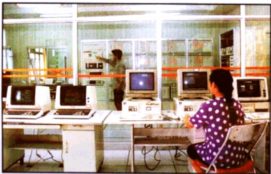
用户电报系统机房