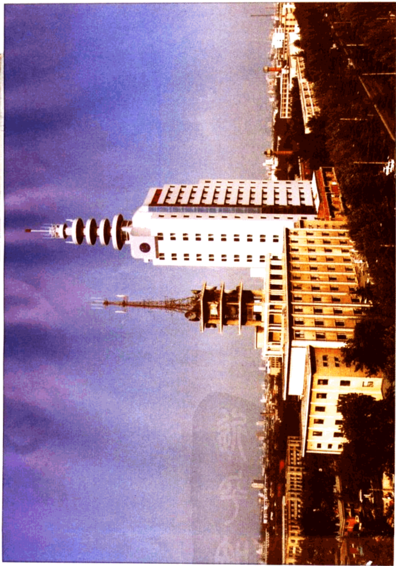
郑州市电信局长途通信枢纽大楼