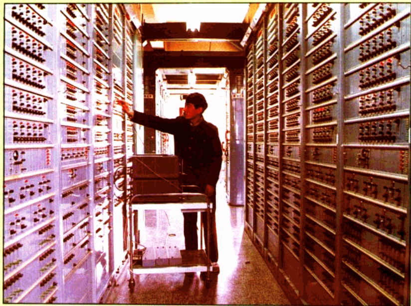
检测长途通信电路