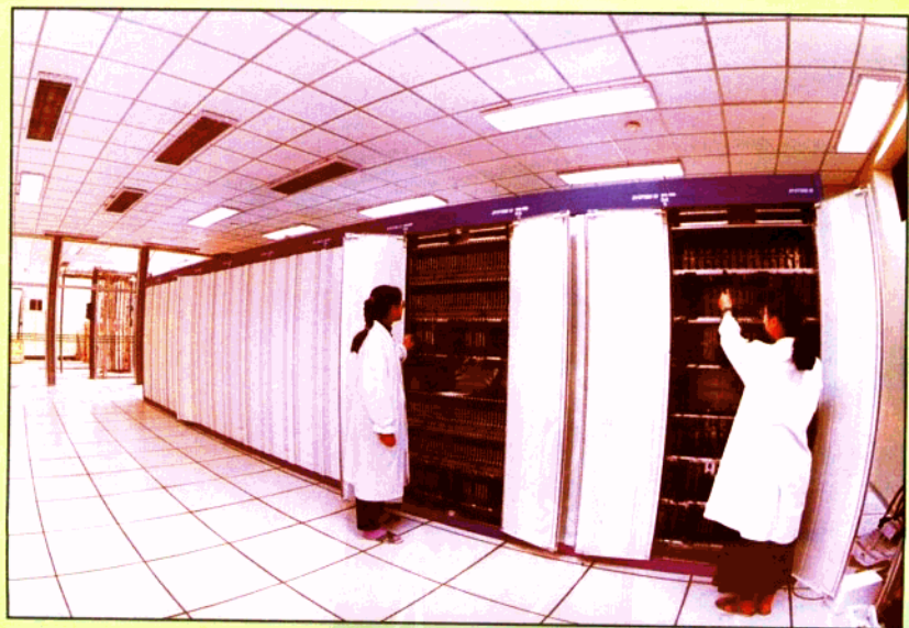
市话程控交换机房