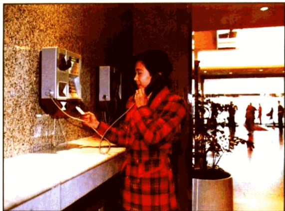
利用磁卡电话通信