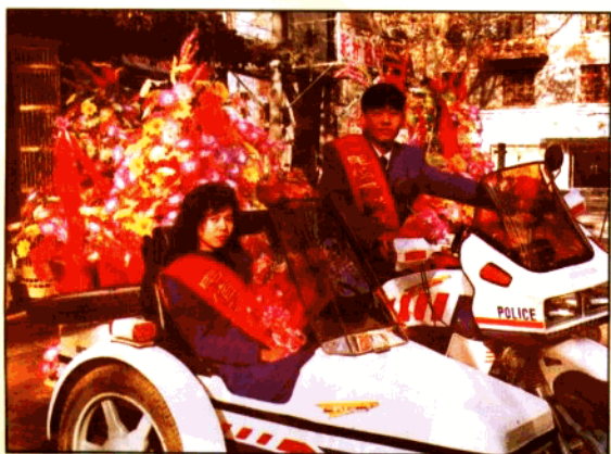
投送鲜花礼仪电报