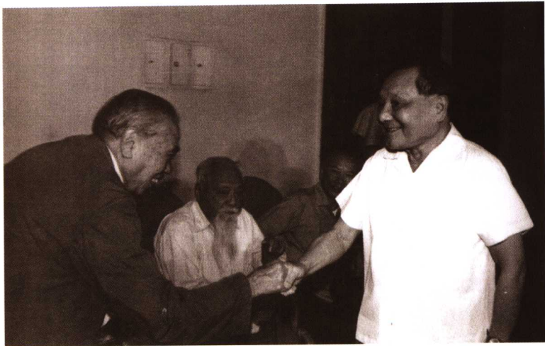
1982年8月，邓小平与朱学范握手。