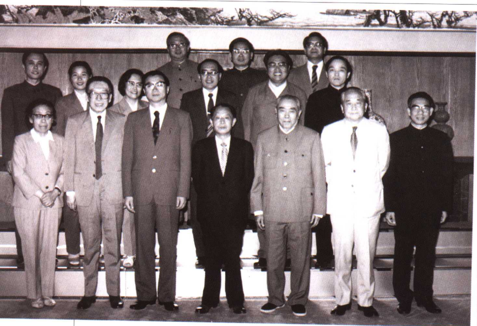
1984年，胡耀邦会见西哈努克亲王和莫尼克公主后，中方人士的合影。（前排中为胡耀邦，右三为朱学范）。