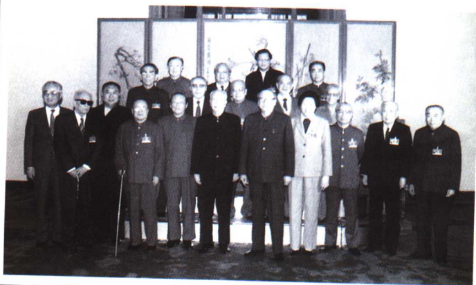
1988年第七届全国人大常委会委员长、副委员长合影（前排右一为朱学范）。