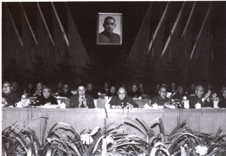
图为1988年11月民革第七次全国代表大会会场。

1988年11月19日，在民革七届一中全会上，朱学范（中）再次当选为民革中央主席。李沛瑶（右）、何鲁丽（左）等当选为副主席。