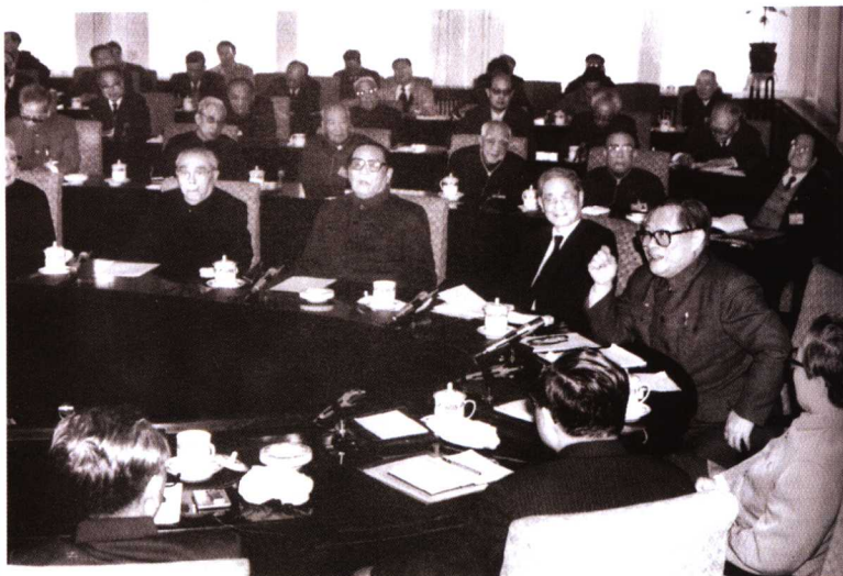
1990年3月19日，各民主党派中央、全国工商联负责人和无党派人士参加中共中央在中南海召开的民主协商会。前排正面右一为江泽民，左二为朱学范。