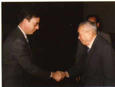
1986年11月4日朱学范接见美国商务部助理部长塞克斯先生。