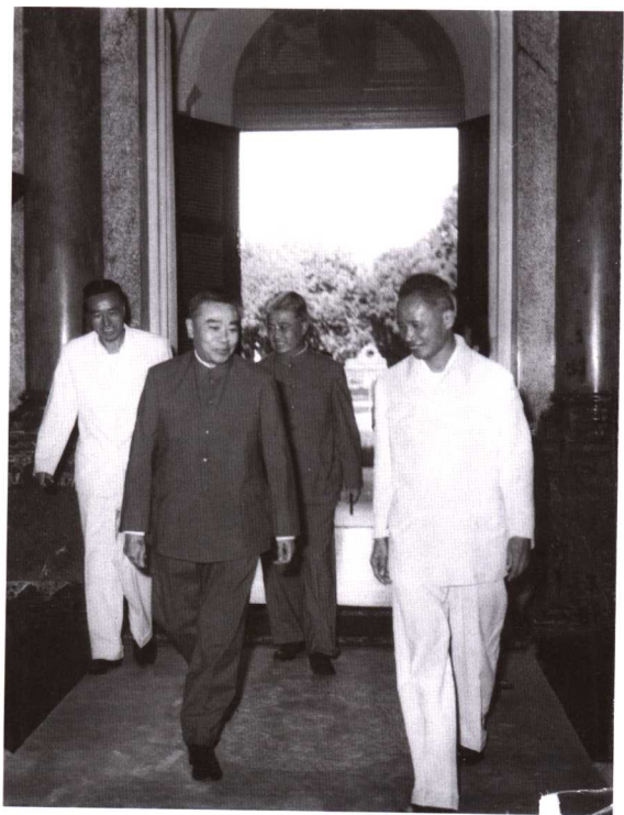
1964年邮电部长朱学范（前排左一）率邮电代表团访问越南，越南总理范文同（前排右一）接见朱学范。