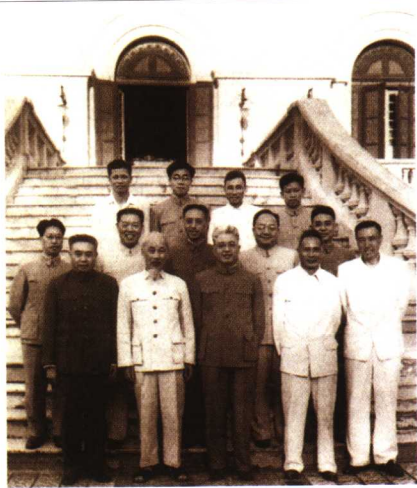
1964年7月朱学范(前排左一)访问越南时同胡志明主席(前排左二)合影。