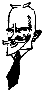
爱尔兰作家 萧伯纳