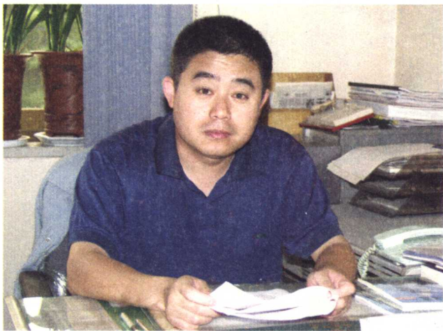
北京动物园园长吴兆铮

在动物园从事野生动物饲养工作需要经过专业培训，但单有理论知识是远不能适应这项工作的，每只动物都有着自己的习性，要完成好饲养任务，除专业理论知识和责任心外，还要不断地学习和积累工作经验，注意发现和了解每只动物