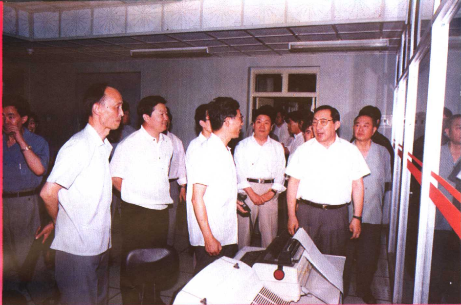
△ 1993年6月,中共中央政治局委员、国务院副总理李岚清(前排右一)视察郑州大学。