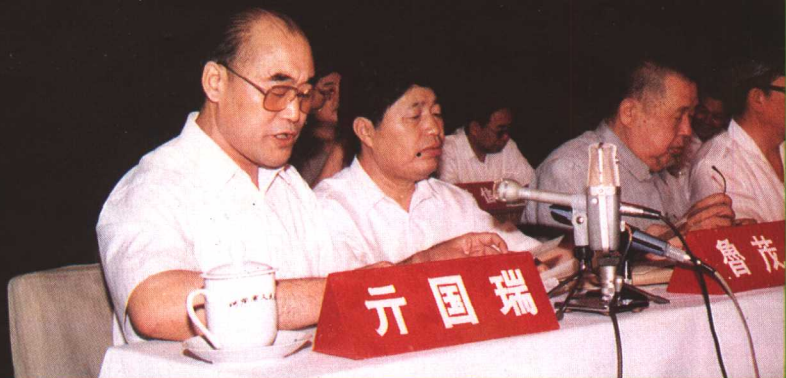
△ 省教委主任、党组书记元国瑞，在全省庆祝教师节暨表彰大会上讲话。