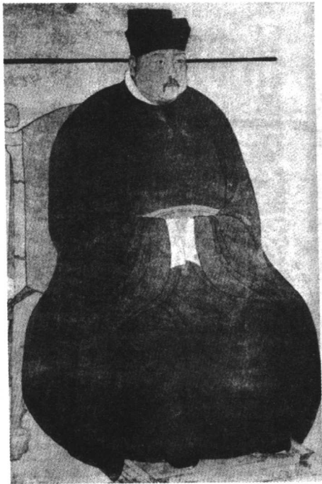
赵恒 （968—1022），即宋真宗，初名德昌，改名元体、元侃、恒，宋太宗第三子。北宋皇帝。997—1022年在位。

扫俗学之凡陋，振弊法之因循，道术必为孔孟，勋绩必为伊周，公之志也。不期人之知，而声光烨奕，一时钜公名贤，为之左次。公之得此，岂偶然哉？用逢其时，君不世出，学焉而后臣之，无愧成汤高宗，公之得君，可谓专矣。新法之议，举朝濯哗，行之未几，天下恟恟。公方秉执周礼，精白言之，自信所学，确乎不疑。君子力争，继之以去；小人投机，密赞其决。忠朴屏伏，金豺得志，曾不为悟，公之蔽也。熙宁排公者，大抵极诋訾之言，而不折之以至理，平者未一二，而激者居八九。上