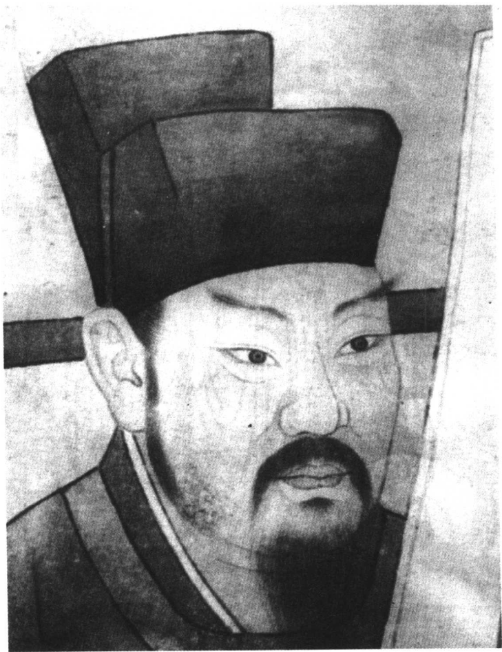
王安石 (1021—1086), 字介甫, 小字獾郎, 号半山, 世称荆公, 抚州临川(今江西抚州)人。北宋大臣, 政治家、文学家。庆历间进士, 神宗时为相, 实行变法。谥文。为唐宋八大家之一。