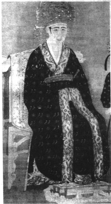
宋仁宗后 （1016—1080），曹氏，真定（今河北正定）人。曹彬孙女。宋仁宗皇后。

人也，而元人尽采私书为正史。当熙宁新法初行，在朝议论蜂起，其事实在新法，尤为有可指数者。及夫元祐诸臣秉政，不惟新法尽变，而党祸蔓延，尤在范、吕诸人初修《神宗实录》。其时邵氏《闻见录》、司马温公《琐语涑水纪闻》、魏道辅《东轩笔录》，已纷纷尽出，则皆阴挟翰墨以饜其忿好之私者为之也。又继以范冲朱墨史，李仁甫长编，凡公所致慨于往者不能论当否、生者不得论曲直，若重为天下后世惜者，而不料公以一身当之，必使天下之恶皆归。至谓宋之亡由安石，岂不过