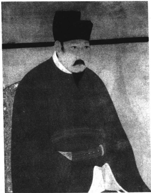
赵禎 （1010—1063），即宋仁宗，初名受益， 宋真宗第六子。北宋皇帝。乾兴元年（1022） 嗣位。太后听政。明道二年（1033）始亲政。 1022—1063年在位。

则不然，公之没去今七百余 余年，其始肆为诋毁者， 多出于私书，既而采私书 为正史，此外事实愈增， 欲辨尤难。（中略）忆公有 《上韶州张殿丞书》，其言 曰：“自三代之时，国各有 史，而当时之史，多世其 家，往往以身死职，不负 其意，盖其所传，皆可考 据。后既无诸侯之史，而 近世非尊爵盛位，虽雄奇 俊烈，道德流行，不幸不 为朝廷所称，辄不得见于 史。而执笔者又杂出一时 之贵人，观其在廷论议之 时，人人得讲其然否，尚