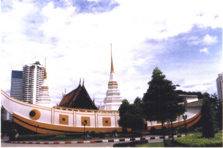
坐落在曼谷石军路的然那瓦寺的红头船