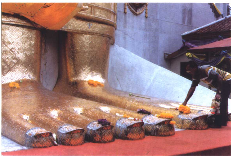
銻菩多大佛之巨足（脚趾比一个人还大）