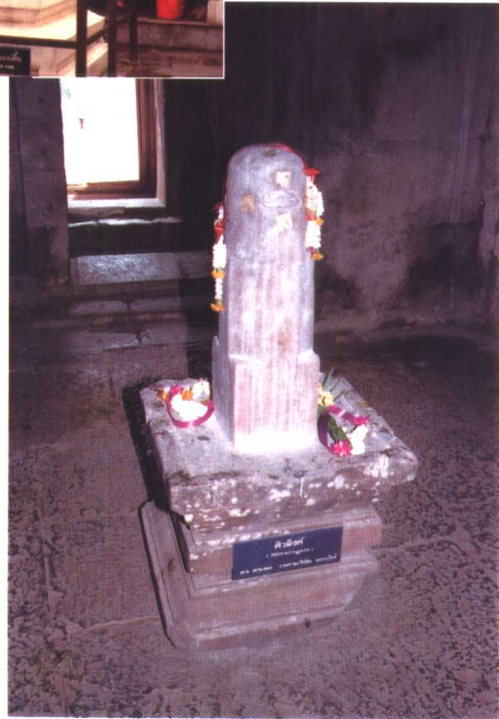
男性生殖器希瓦楞 崇拜