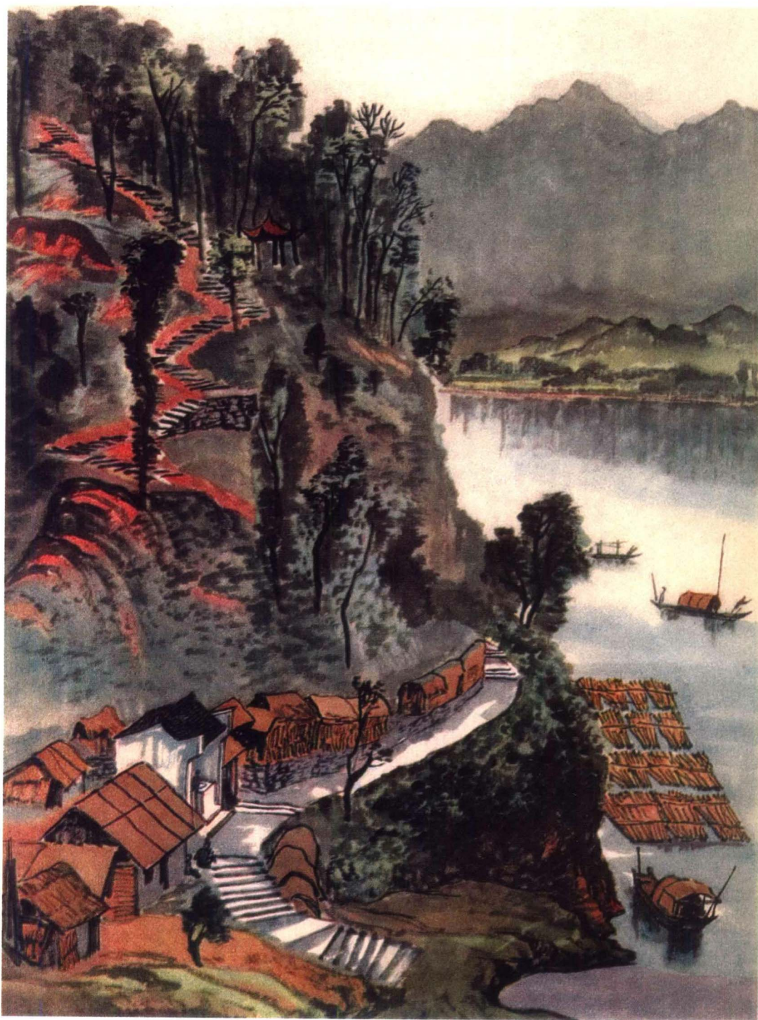
作品名称：桐君山 / 创作年代：1954年