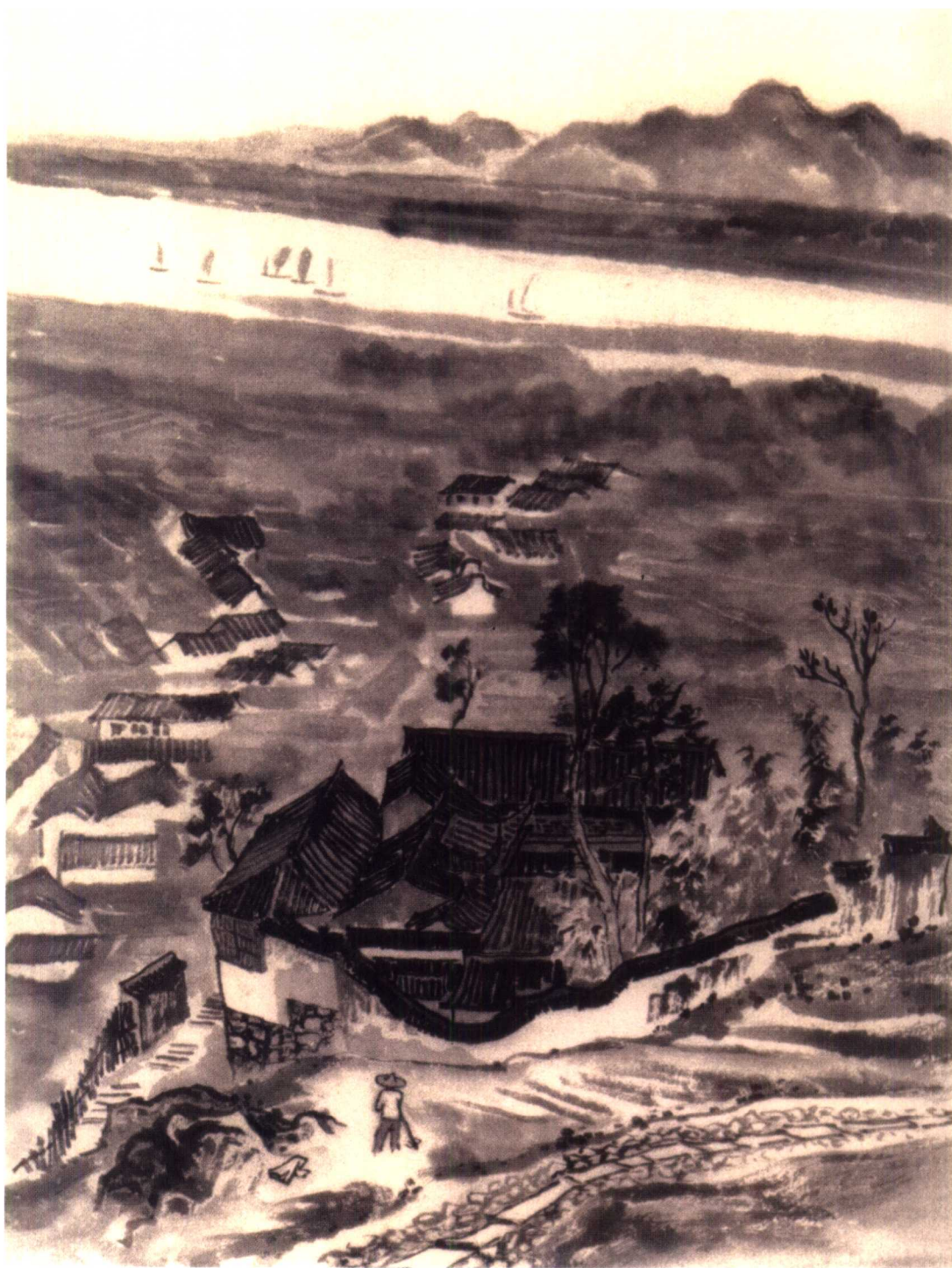
作品名称：从城隍山远眺钱塘江 / 创作年代：1954年