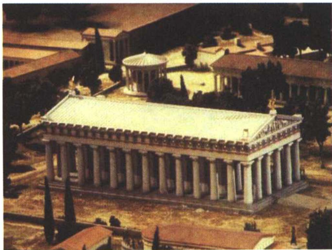
古代奥运会宙斯神庙的想像图