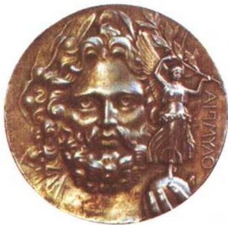
1896年第1届希腊雅典奥运会奖牌正面

雅典获得了首届现代奥运会主办权后，国际奥委会第一任主席泽麦特里乌斯·维凯拉斯将召开奥运会的喜讯带回了雅典。雅典的百姓高兴地期待着第1届现代奥运会在雅典举行，期待看到古代奥运会的复兴。可是，希腊首相特里库皮斯在查看了断垣残壁的雅典古运动场遗址后感到，在这样的废墟上重建运动场需要一大笔资金，而雅典当时负债累累，于是他坚决反对在雅典举办奥运会。