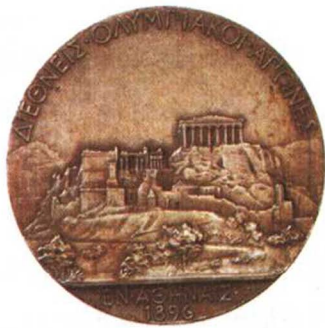
1896年第1届希腊雅典奥运会奖牌背面

特里库皮斯本是个开明的政治家，但希腊当时的困境不允许他支持举办奥运会。希腊1829年才从土耳其的长期统治下独立出来。虽然完成了独立大业，但独立战争所带来的重创，却使希腊成了欧洲最落后的国家。经济萧条，外债累累，使希腊经济在1893年濒临崩溃。为了国家的利益，特里库皮斯无法同意在如此的困境中去举办耗资巨大的现代奥运会。特里库皮斯的作为，给政敌提供了攻击他的机会。政敌利用民众对现代奥运会的热切期盼，试图在竞选中把特里库皮斯赶下台。