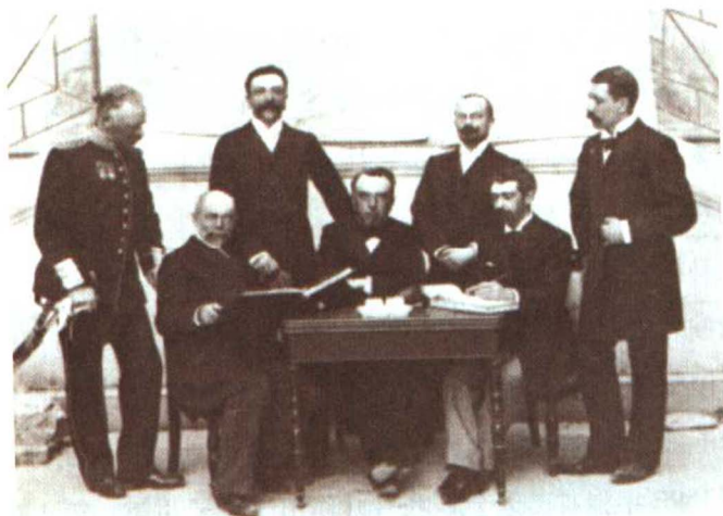
第1届国际奥林匹克委员会成员

大会还规定奥运会的比赛项目为田径、水上运动、游泳、划船、帆船、击剑、摔跤、拳击、马术、射击、体操、球类运动等。