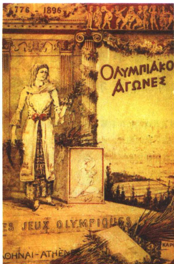
1896年第1届希腊雅典奥运会会徽

雅典开创性地举办了第1届现代奥运会。首届奥运会既没有会徽也没有主题宣传画，这幅被后人作为会徽的画面是雅典奥委会向国际奥委会提交的报告的封面。雄浑的雅典卫城，手执橄榄枝的雅典娜女神，深嵌的马蹄印，散发着浓厚的古希腊气息。左上方公元前776—1896的字样表示现代奥运会与古代奥运会一脉相承的关系。