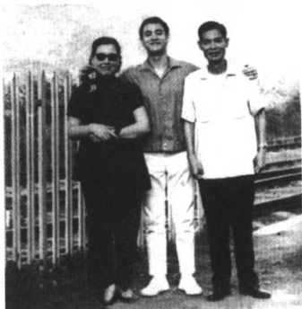
李小龙与父母合影

义南,他跟李海泉说:“贵公子取名震藩,这个‘震’字,与爷爷李震彪的‘震’属同一字辈,这样,孙子与爷爷岂不是同一辈的人吗?此乃大忌也!”