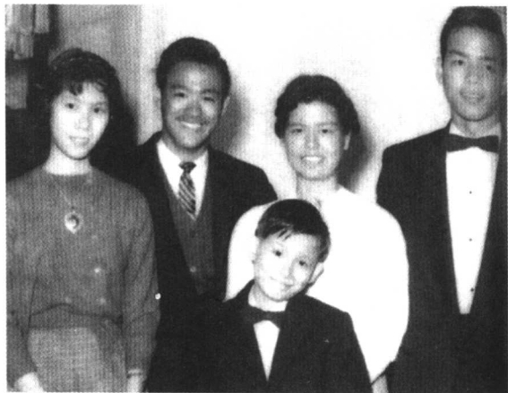
李小龙兄弟姊妹合影

他还喜欢恶作剧,耍弄人的花样层出不穷,对象由家人至仆人差不多无一幸免。母亲何爱瑜谈起小龙的恶作剧时说: