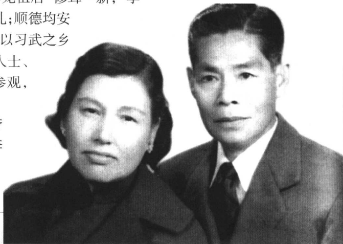
李小龙的生身父母