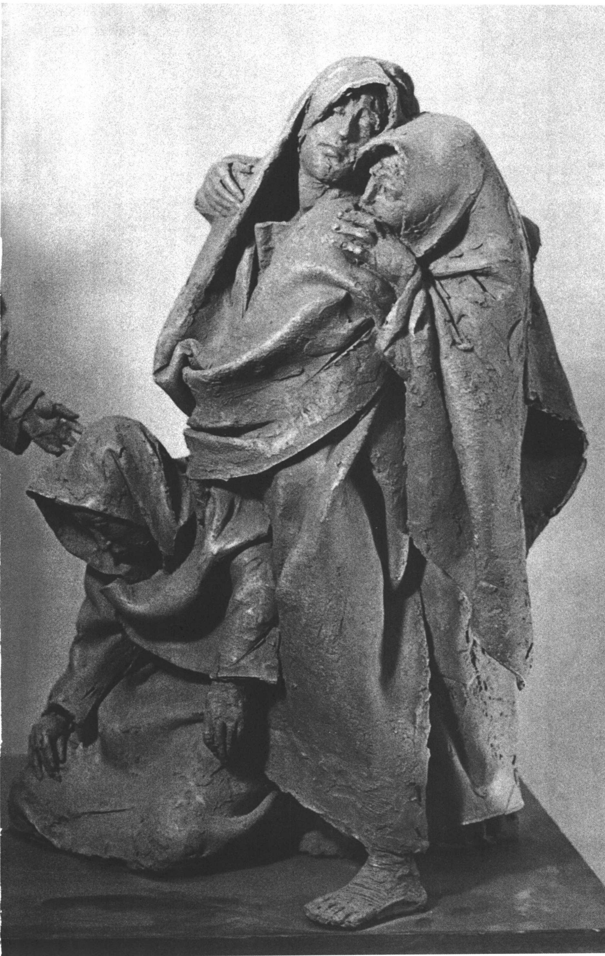
特洛伊女人 赤陶 45.7cm×68.6cm