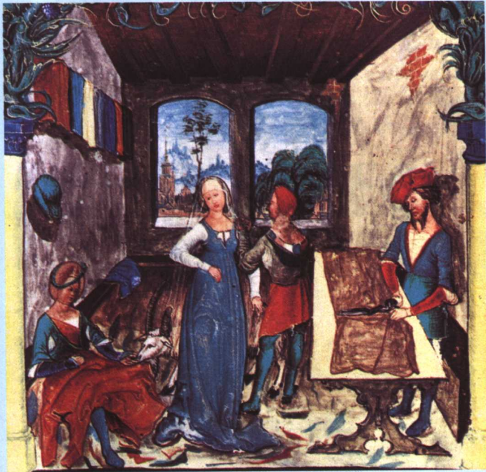
《波兰人的裁缝店》，16世纪，波兰克拉科加各罗宁图书馆