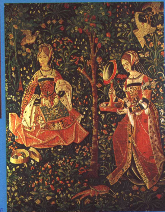
《正在绣花的女人》，绒绣，16世纪，巴黎克鲁尼博物馆