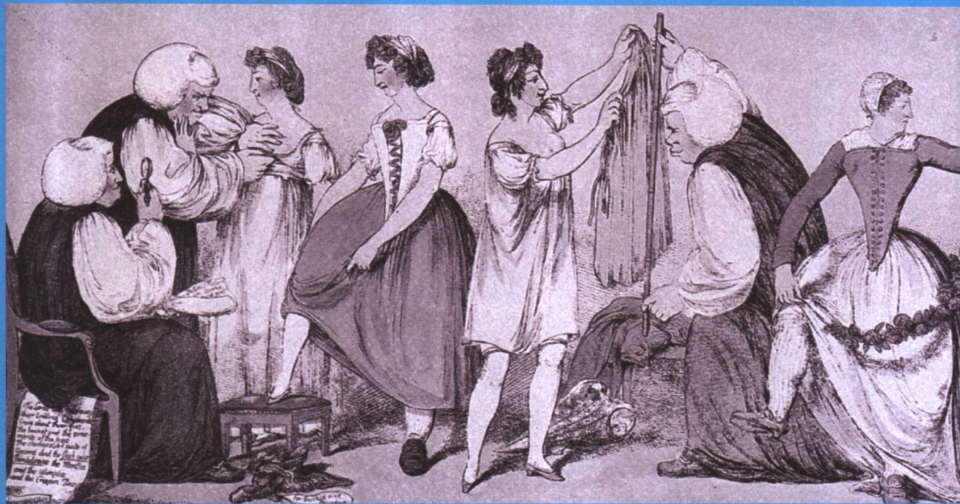
《忙碌着的裁缝们》，大英博物馆