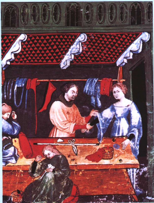
《意大利人的裁缝店》，16世纪，巴黎国家图书馆