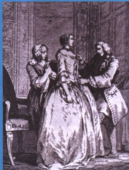
《为女人量体裁衣》，18世纪，克琴（C.N.Cochin）

女人做的大多是“针线活”，比如手工缝补、编织或者绣花，在英文里被称为“Needleworker”，意思是“做针线活的人”，与“裁缝”（Tailor）的概念，尚有一定的差异。