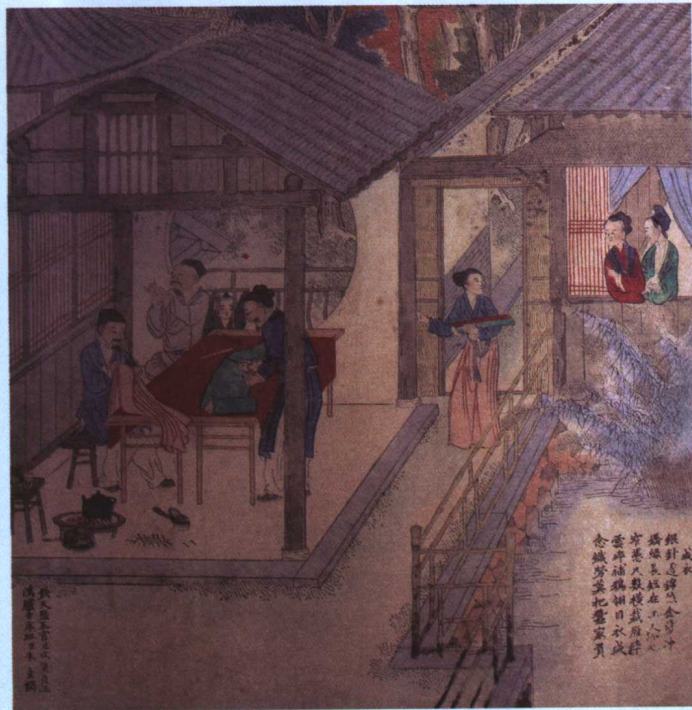
《成衣》，取自《耕织图》，清末，焦秉真绘，北京图书馆

尽管这三幅描述裁缝店情景的绘画分别来自于不同的国家，可是做裁缝“主刀”的都是男性，女性无一例外地都扮演着缝缝补补辅助类工作的角色。