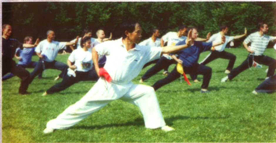
作者在辅导外国学员练习中国功夫