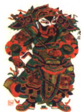
朱仙镇年画七日谈

然，现代人对黄河的认识和实践远远不止于水利黄河。摆在现代人面前的还有军事黄河、环保黄河、历史黄河、地理黄河、文化黄河、旅游黄河、交通黄河、生态黄河等等。我们对黄河的认识还远远没有完结，单是老祖先留给我们关于黄河的问题，我们尚未吃透，且不说上面所说的文化黄河、军事黄河等等。就拿文化黄河来说，黄河文化源远流长，底蕴丰厚，是一座开采不完的金矿，一座未知的“金字塔”。几千年来，依黄河而居的先人一方面不停顿地创造黄河文化，一方面又不停顿地总结黄河文化，留下了大量的黄河文化研究史料。在博物馆、图书馆和书店，有关黄河的史料可谓“汗牛充栋”。十年前，中国科学出版社出版了一套由中国科学院和中国工程院院士编写的科普丛书，其中有一本名叫《黄河》，主要讲黄河是如何形成的，看后让人茅塞顿开。说真的，作为黄河儿女，我们对黄河文化知之太少了，研究的也太少了。例如黄河的源头究竟在哪里，黄河是如何形成的，万里