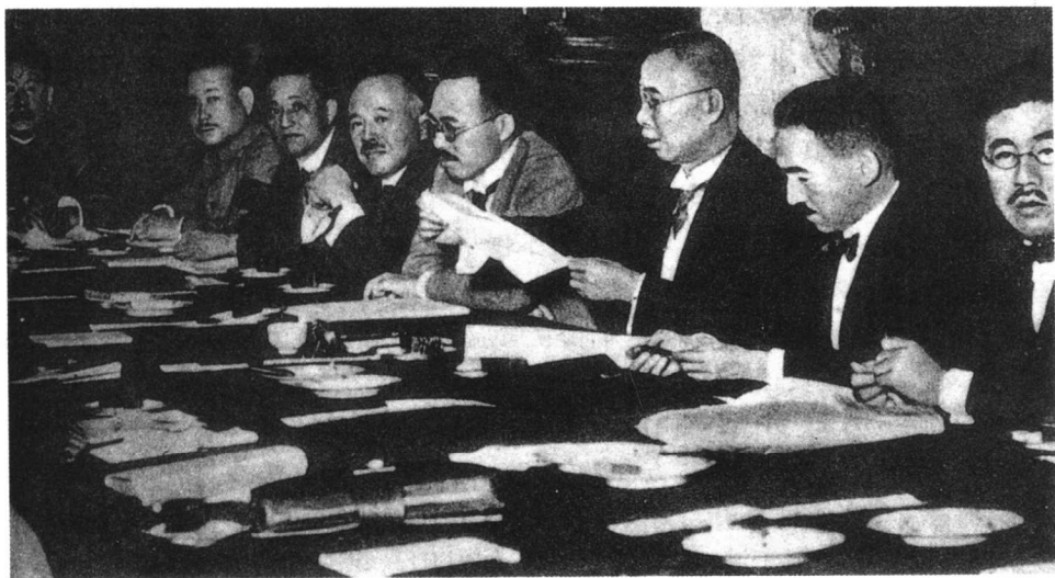
日本帝国主义独占中国的图谋由来已久。图为1927年6月27日至7月7日日本田中内阁召开的“东方会议”。会议确定了把“满蒙”同“中国本土”分离开来的方针,制定了先征服“满蒙”,再征服“支那”的计划。右起第3人为日本首相田中义一。

此乃明治大帝之遗策,是亦我日本帝国之存立上必要之事也……考我国之现势及将来,如欲造成昭和新政,必须以积极的对满蒙强取权利为主义。以权利而培养贸易,此不但可制支那工业之发达,亦可避欧势东渐,策之优,计之善,莫过于此。我对满蒙权利如可真实的〔地〕到我手,则以满蒙为根据,以贸易之假面具风靡支那四百余州;再则以满蒙之权利为司令塔,而攫取全支那之利源。以支那之富源而作征服印度及南洋各岛以及中小亚细亚、欧罗巴之用,我大和民族之欲步武于亚细亚大陆者,握执满蒙权利乃其第一大关键也。” ①