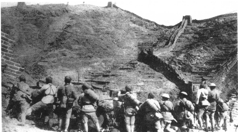
1933年3月,日本侵略军进犯长城各关口。驻守喜峰口的国民党第29军英勇抵抗。图为中国军队在喜峰口与古北口之间的罗文峪布防。

日本侵吞中国东北3省后,按既定计划发动对华北的进攻。1933年1月初日军攻占山海关,3月侵占了热河全省,接着向长城一线进犯。国民党第29军、第32军、第17军和东北军一部在长城之喜峰口、冷口、古北口等地进行了英勇抗击。但是,由于蒋介石推行“攘外必先安内”政策,集中力量“围剿”中国工农红军,不向长城防线增援,致使守军在日军的疯狂进攻下于5月中旬放弃长城防线,河北省东部20余县遂陷入敌手。5月31日,南京国民政府与日本达成了出卖领土主权的《塘