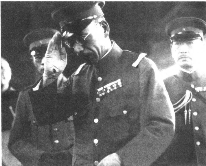
1936年春,日本开始增兵华北,图为田代统一郎中将至津就任,成为军衔最高的日本华北驻屯军司令官。羽毛渐丰的华北驻屯军开始取代关东军成为侵华的急先锋。

二二六政变后上台的广田弘毅内阁完全听命于军部。1936年8月7日,日本在首相、外相、陆相、海相、藏相参加的五相会议上,通过了《国策大纲》,首次把北进和南进两个方面并列为基本国策。《国策大纲》提出“帝国当前应该确立的根本国策,在于外交和国防互相配合,一方面确保帝国在东亚大陆的地位,另一方面向南方海