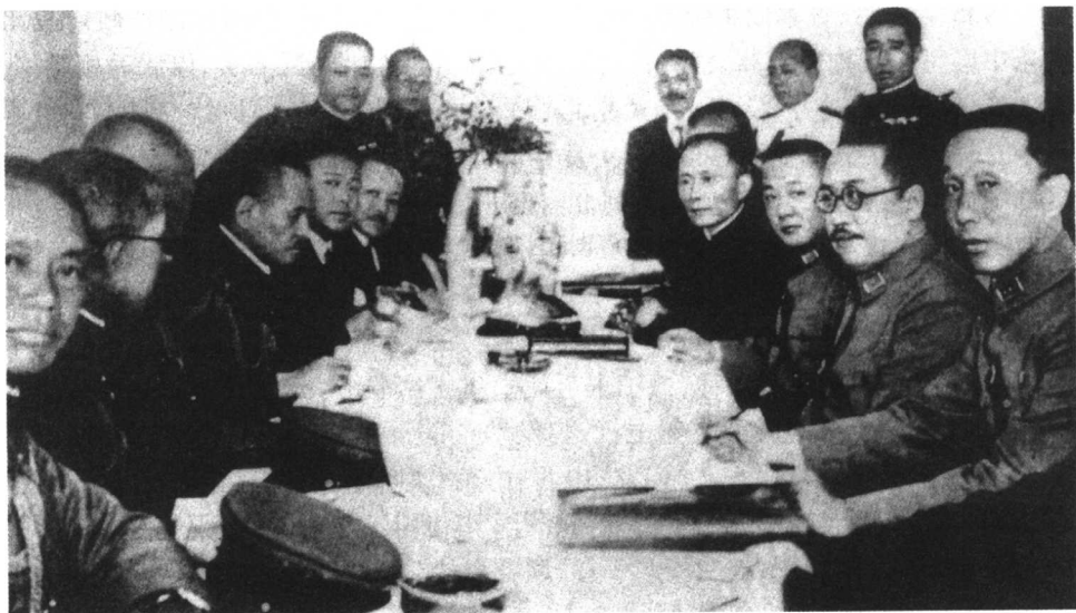
日军攻占冷口、滦东后，兵逼平津，迫使中国政府签订了《塘沽协定》，默认日本对东北、热河的军事占领，冀东作为缓冲区任由日军自由出入，华北门户洞开。图为中（右）日双方代表在塘沽会议上。

沽协定》，规定中国军队立即撤退至延庆、昌平、高丽营、顺义、通州、香河、宝坻、林亭口、宁河、芦台所连之线以西以南地区，不得越过该线，不得有挑战扰乱之行动。日军为确悉上述规定执行情形，随时可用飞机及其他方法进行观察，中国方面对此应加以保护及予以各种便利。日军在证实中国军队遵守上述规定后，不再越过该线追击，并自动归还至长城之线。长城线以南及上述规定之线以北以东地区的治安维持，由中国警察机关担任，但不得用刺激日军感情的武力团体。这个协定，不仅事实上承认了日本占领东北3省和热河的合法性，而且将冀东各县划为日军可以“自由行动”而中国军队不能进入的“非武装区”，中国军队则退至北平、天津附近。这样，就置华北于日军监视和控制之下，为日本攻取北平、天津，进而夺取整个华北打开了方便之门。