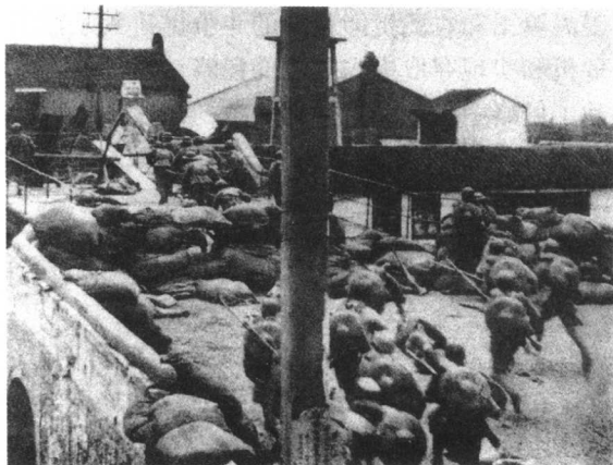
驻守上海的国民党第19路军3万余爱国官兵在蒋光鼐、蔡廷锴率领下,英勇抗击日本侵略军。图为第19路军士兵在追击逃窜的日军。

1932年1月28日,日军对上海驻军发动军事进攻,制造了一·二八事变。在国民党爱国将领蔡廷锴、蒋光鼐和张治中的指挥下,国民党第19路军和第5军等部队进行了英勇的抵抗,打退了日军的连续进攻。日军死伤逾万,并三易主帅。然而,国民党蒋介石政府决意对日妥协,不向上海增派援军,致使第19路军和第5军在优势敌军进攻下被迫撤离上海。5月5日,南京国民政府与日本签订了丧权辱国的《淞沪停战协定》,承认日军可以留驻上海,而中国军队必须撤离上海且不得在上海周围地区驻防,并取缔抗日活动。