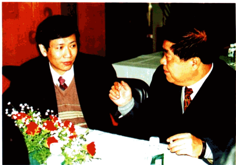
时任四川省省长宋宝瑞就金融话题接受作者访谈。(摄于一九九八年冬)