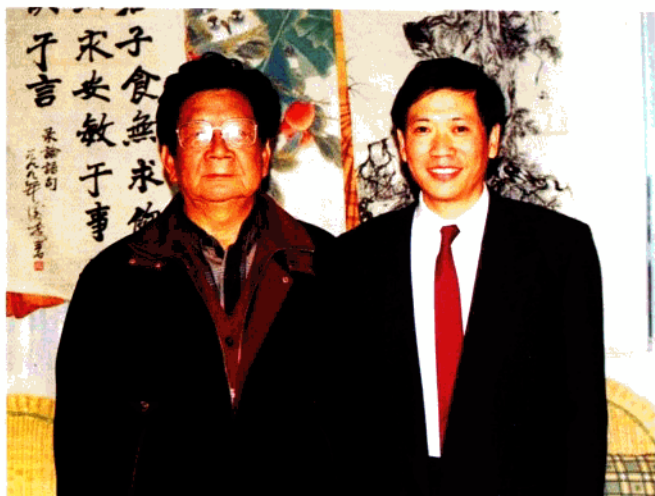
作者的作品前，与中国美术家协会副主席李焕民合影。