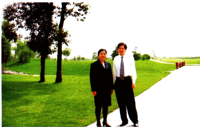
作者与中国人民银行北京营业管理部主任韩平合影。