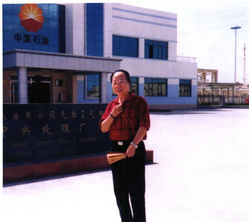
在新疆“西气东输”起点站