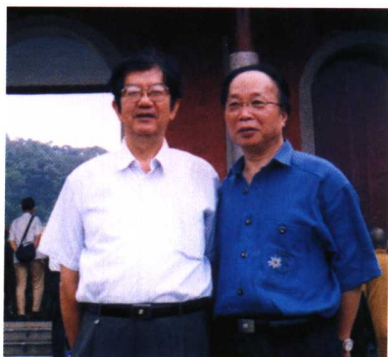
泉州文化界名人陈瑞统（左）