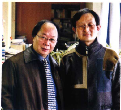
关注民生的报告文学“尖兵”胡展奋（右）