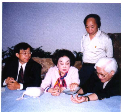
在上海博物馆鉴赏国宝级瓷器