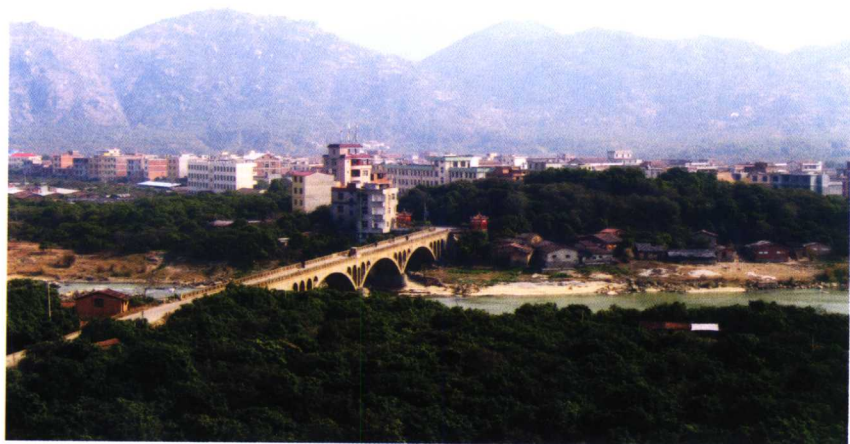
作者家乡闽中莆田市华亭镇园头村

故乡是河，你是一条深情的鱼； 故乡是天，你是一朵继续的云； 故乡是宽厚的老师，你是元满童真的学生； 故乡是慈爱的母亲，你是常怀歉疚的儿子。