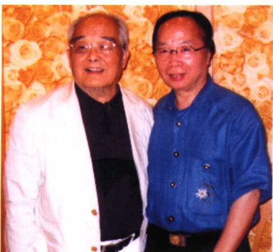
著名诗人黎焕颐（左）