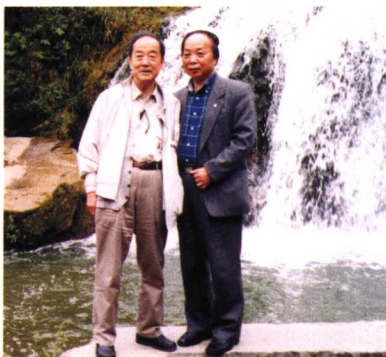
著名诗人邵燕祥（左）