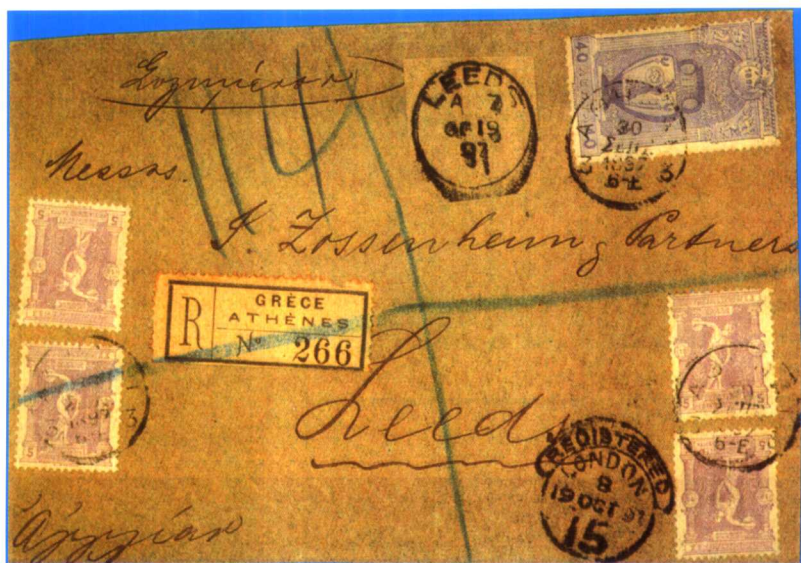
(1-7): 希腊首届奥运会实寄封 (贴多枚票, 有挂号标签)。