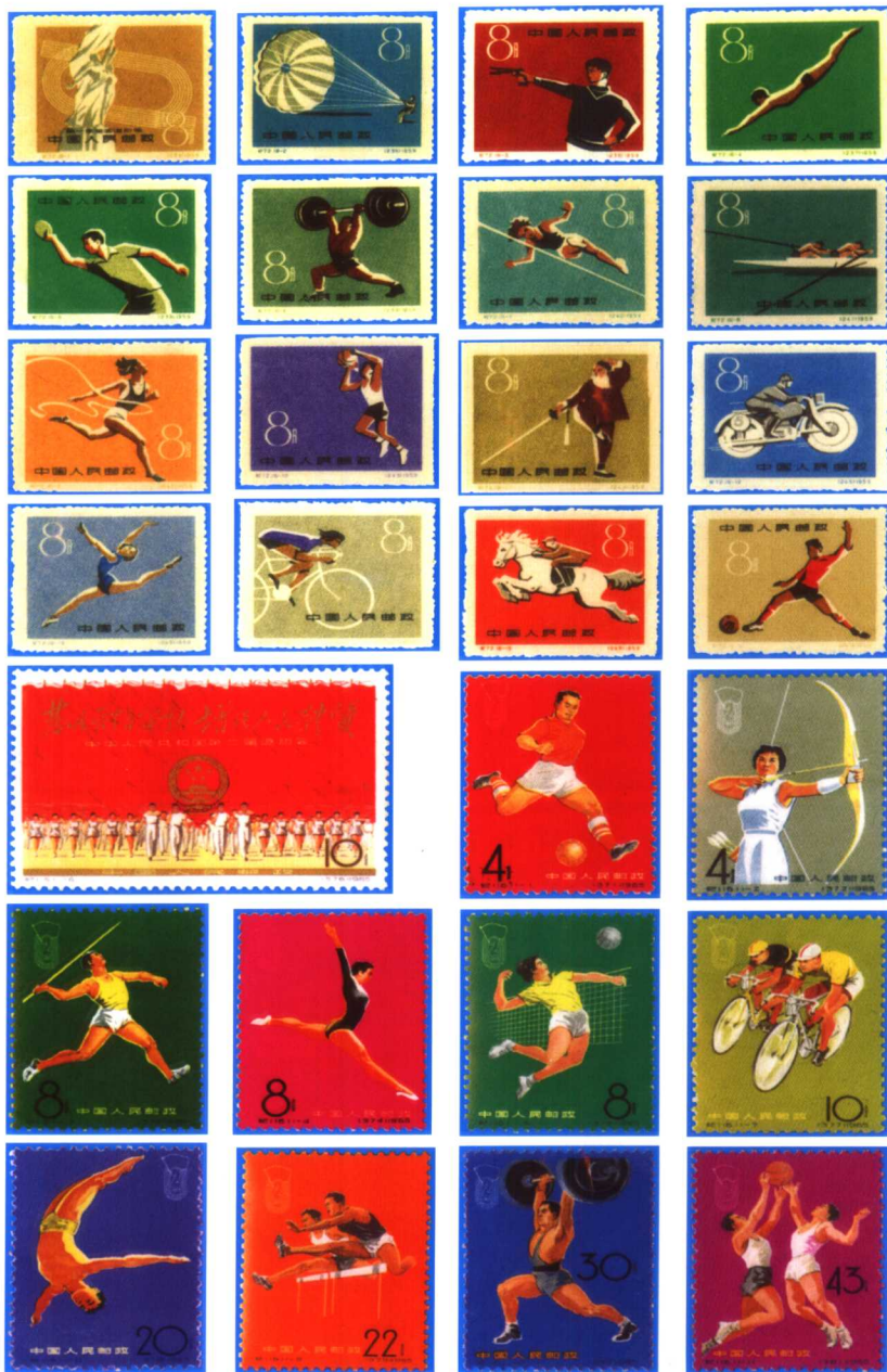
(1-2): 中国第一届、第二届全运会邮票各一套。