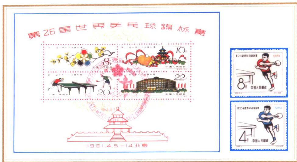
(1-3): 中国第25届、第26届世乒赛邮票一套和小全张一枚。