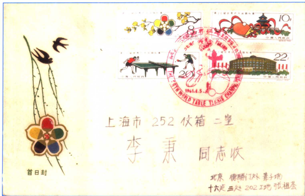
(1-4): 中国第26届世乒赛首日实寄封。