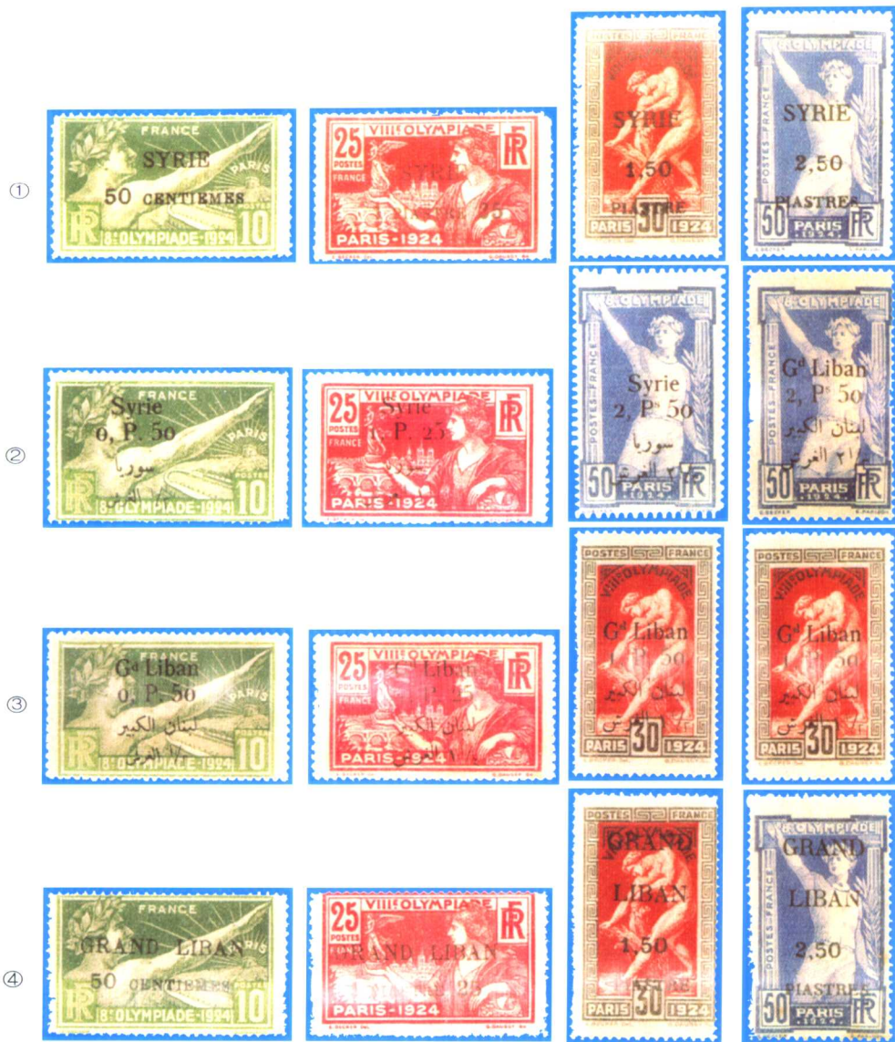
(1—11): ①在法国1924年奥运邮票上加盖“叙利亚”(法文)及新邮资而发行。②在法国1924年奥运邮票上加盖“叙利亚”(法文及阿拉伯文)及新邮资而发行。③在法国1924年奥运邮票上加盖“黎巴嫩”(法文)及新邮资而发行。④在法国1924年奥运邮票上加盖“黎巴嫩”(法文及阿拉伯文)及新邮资而发行。