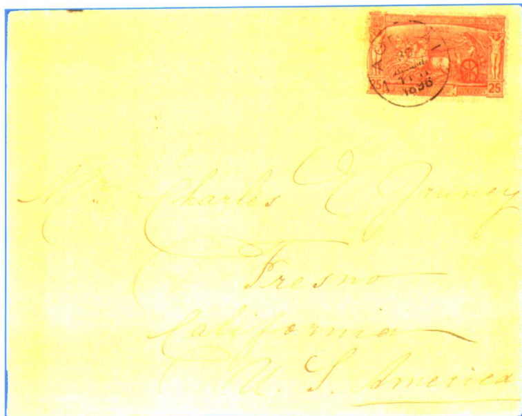
(1-6): 希腊 1896 年首届奥运会实寄封。