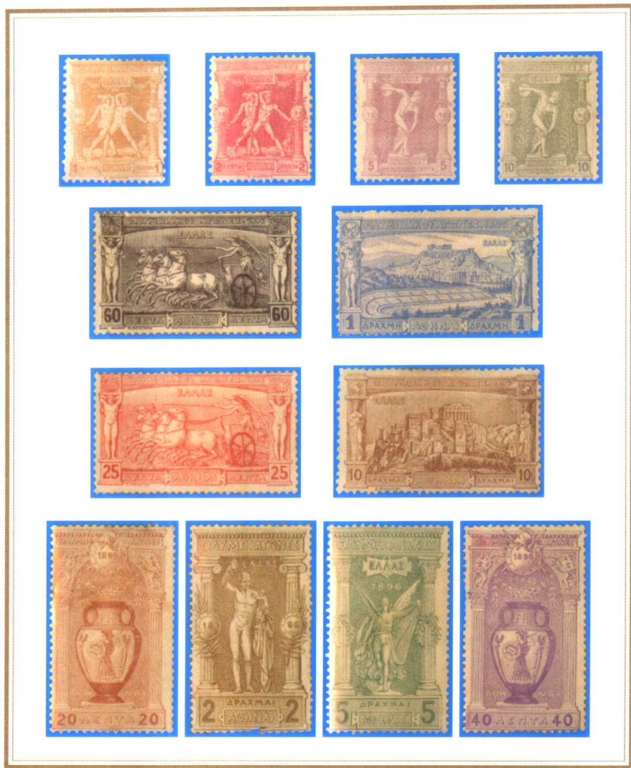
(1—5): 希腊 1896 年首届奥运会邮票 (12 全)。