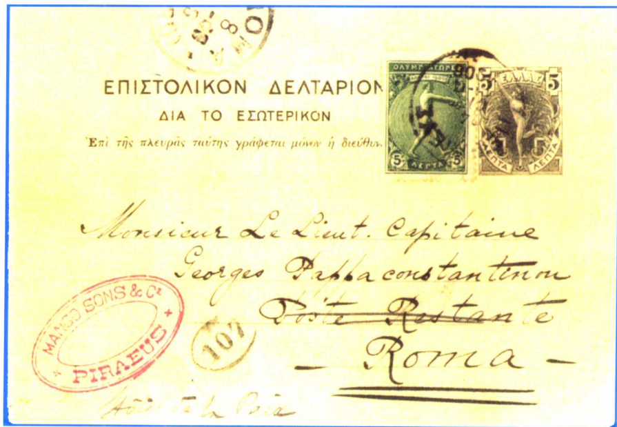
(1-9): 希腊1906年奥运实寄片(2枚)。