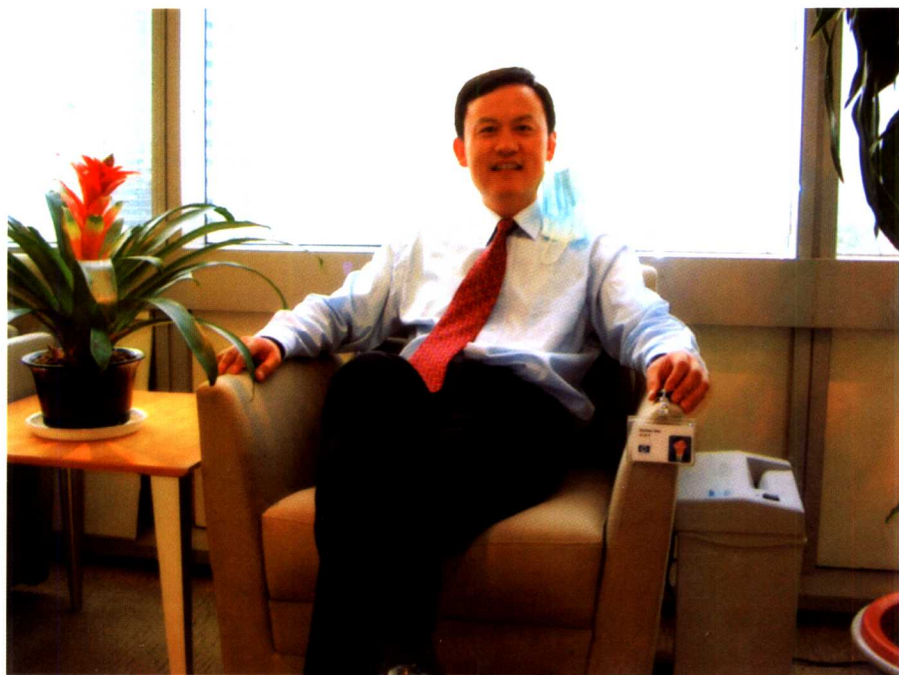
2003年第三次离开惠普前在中国惠普办公室