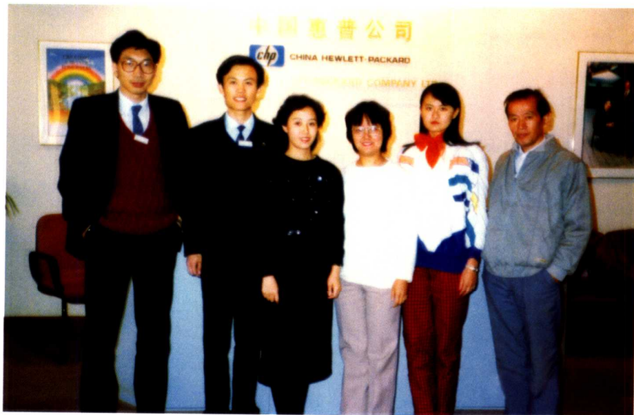
1988年中国惠普的市场部人员合影