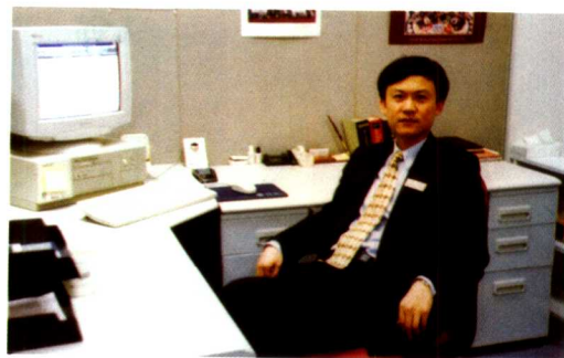
1997年第二次进入惠普, 在办公室