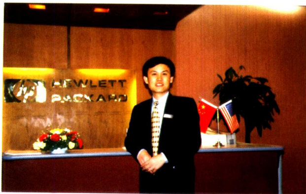
1997年第二次进入 惠普,在前台