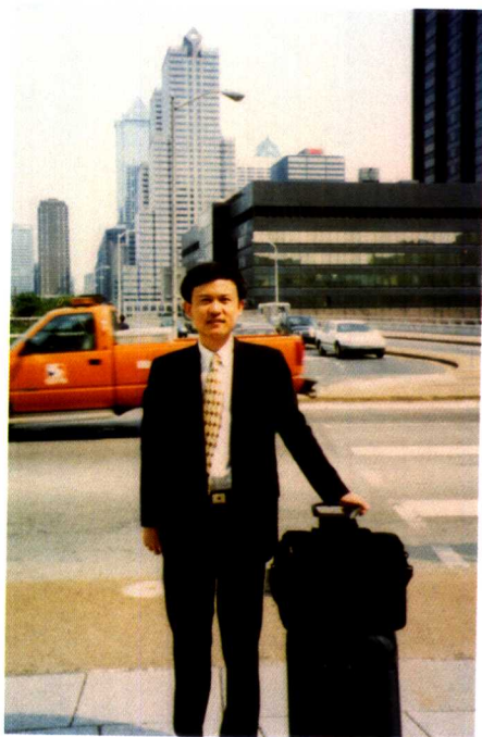
1997年到美国 费城访问客户