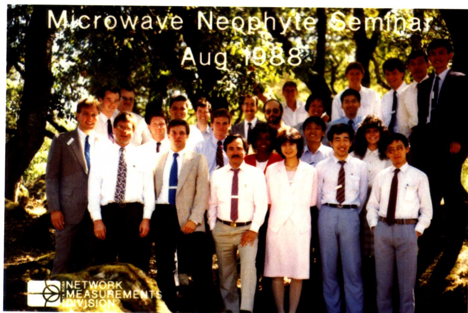
1988年第一次到美国参加培训合影