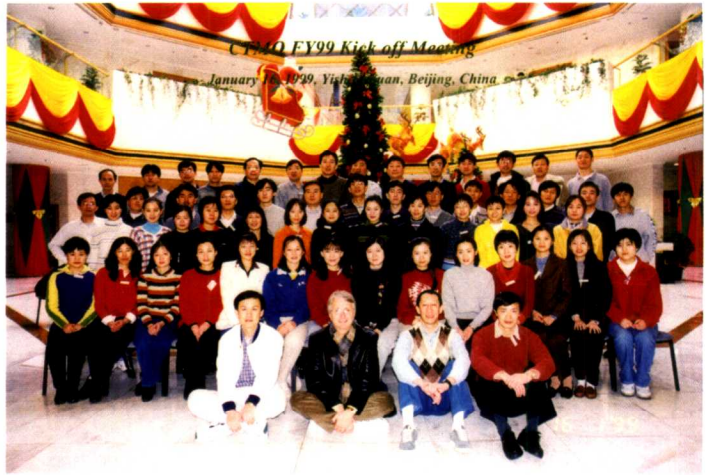
1999年惠普测量仪器 分部年度会议合影