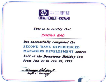
有经验的管理者培训证书