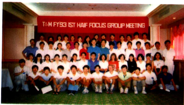
1st Half T&M Focus Group Meeting Sanya, Hainan Island / 1993. 6. 6.