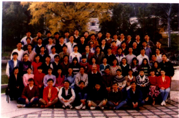
FY94 CHP TMO Kick-off Meeting Fragrant Hill, Beijing, 11.3, 1993.