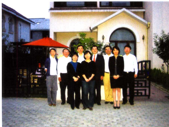
2003年5月第三次离开 惠普同事聚会留影