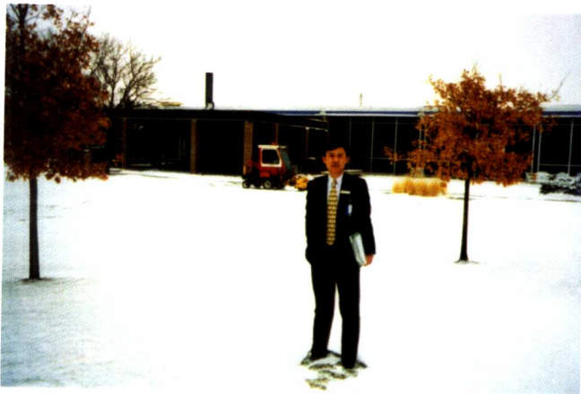
1998年在美国 惠普工厂留影