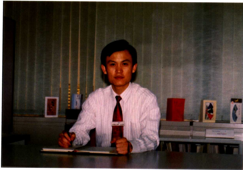
1992年在中国惠普办公室