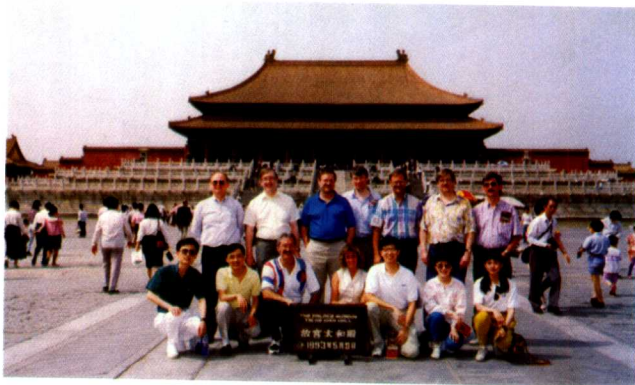
1993年与惠普亚太区 高管团队在故宫合影