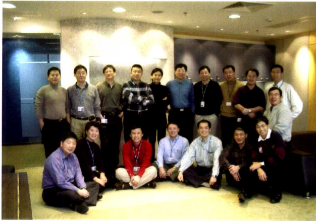
2002年公司决策 委员会成员与分 公司总经理合影