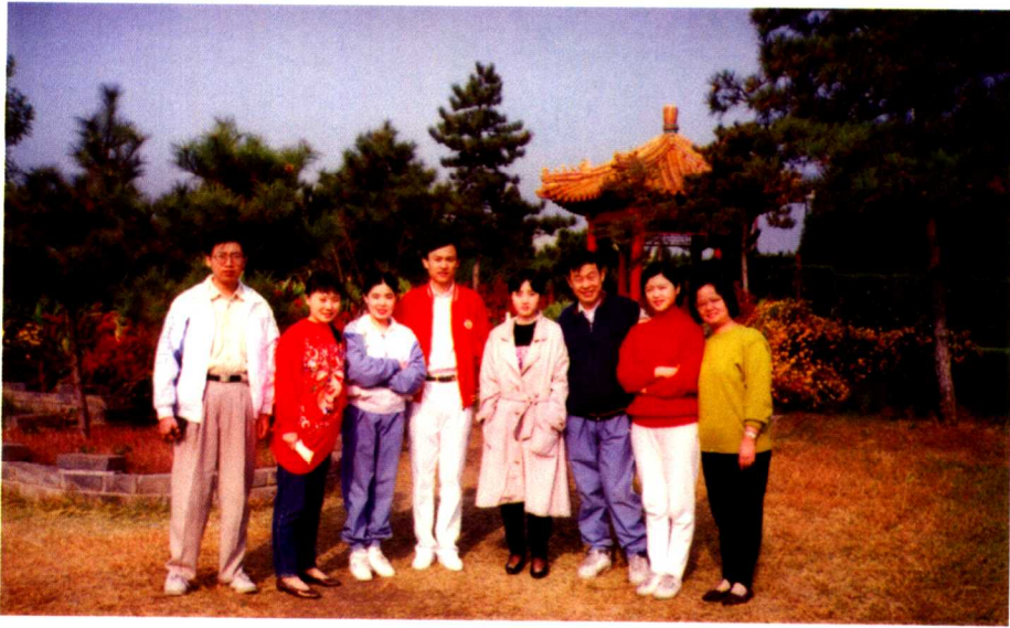
1994年离职欢送会与市场部员工合影