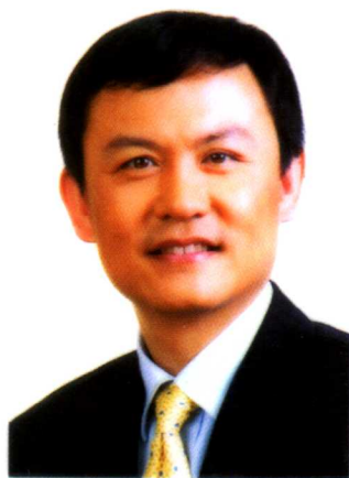
惠友俱乐部会员证