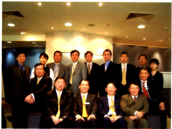
2002年惠普康柏合并前最后 一次决策委员会成员合影