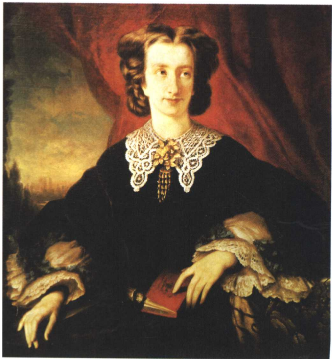
李斯特的女儿， 瓦格纳的第二个妻子 科西玛

1869年9月22日，路德维希二世在违反瓦格纳意愿的前提下，坚持在慕尼黑首演了《莱茵的黄金》，第二年，他同样不顾瓦格纳的抗议，又首演了《女武神》。瓦格纳深信他的《尼伯龙根的指环》在传统剧院不可能获得最佳演出效果，于是，他与路德维希二世的冲突已经不可避免。他开始认真地为上演《尼伯龙根的指环》找一个合适的演出地点。他想到了一个他曾经路过的小城拜罗伊特，那里的采邑伯爵剧院有一个超大型的舞台。可是当他1871年4月前往实地考察时，发现它并不适合演《指环》。瓦格纳当场就决定在拜罗伊特重新建一座新剧院。他知道这样大的工程需要不菲的资金，以后的五年他都不辞劳苦地为这项计划寻求财政支援。在年轻钢琴家陶西格的建议下，发行“赞助卡”来募集资金。后来赫克尔又筹备成立了“瓦格纳协会”，让财力不足的赞助人以合资形式购买赞助卡。