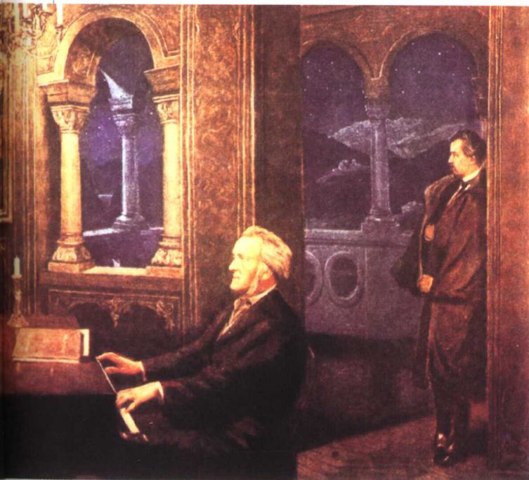
瓦格纳在天鹅堡 为路德维希二世演奏