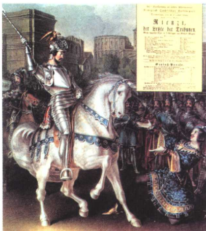
《黎恩济》在德累斯頓的首演(1842年)

不到工资的指挥职位，明娜虽然与瓦格纳举行了婚礼，但对二人的经济前景忧心忡忡，一度还曾离开过瓦格纳。1837年，里加的一家歌剧院邀请瓦格纳出任音乐总监，他在那里开始构思歌剧《黎恩济》。由于身负重债，瓦格纳不得不在夜幕下逃离